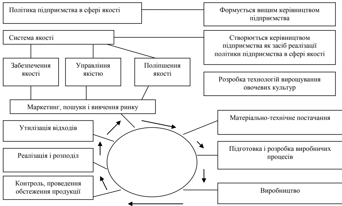
Рис. 2. Етапи життєвого циклу формування якості овочевої продукції

можна підвищити, використовуючи операційний леве́рідж, тому що він дозволяє з'ясувати ступінь і напрямки впливу динаміки цін під впливом інфляції і натурального обсягу продажів, що залежить від коливань кон'юнктури ринку, на розмір одержуваного прибутку. У реальних умовах, як правило, відбувається одночасна зміна і цін, і натурального обсягу продажів, причому обидва фактори можуть діяти різноспрямовано.