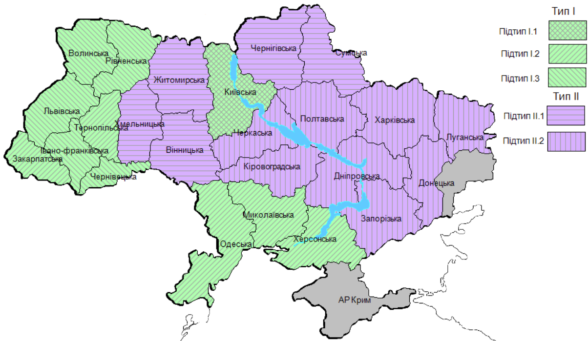
Рис. 2. Типізація адміністративних областей України за темпами приросту/скорочення сільського населення за період 1991-2019рр. (побудовано автором)

До першого типу увійшло 10 областей: Київська, Тернопільська, Одеська, Херсонська, Закарпатська, Чернівецька, Івано-Франківська, Львівська, Рівненська та Волинська. Вони ж в свою чергу розподілилися на 3 підтипи.