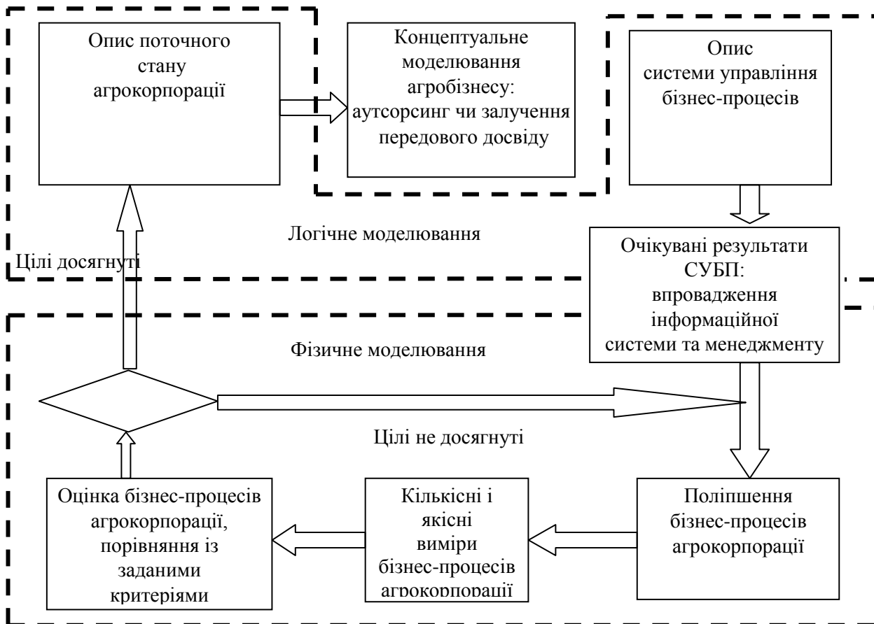
Рис. 1. Бізнес-моделювання діяльності агрокорпорації в умовах міжкорпоративних відносин

У другому розділі «Аналіз організаційної регламентації бізнес-процесів міжкорпоративних відносин агропромислових підприємств» визначено і охарактеризовано мережні засоби організаційної регламентації бізнес-процесів корпоративних підприємств АПК; здійснено аналіз регламентації міжкорпоративних відносин розподілу агрохолдингу ТОВ «ХАН і Ко Київ»; узагальнено тенденції та визначено проблеми розвитку організаційної регламентації міжкорпоративних відносин агропромислових підприємств.