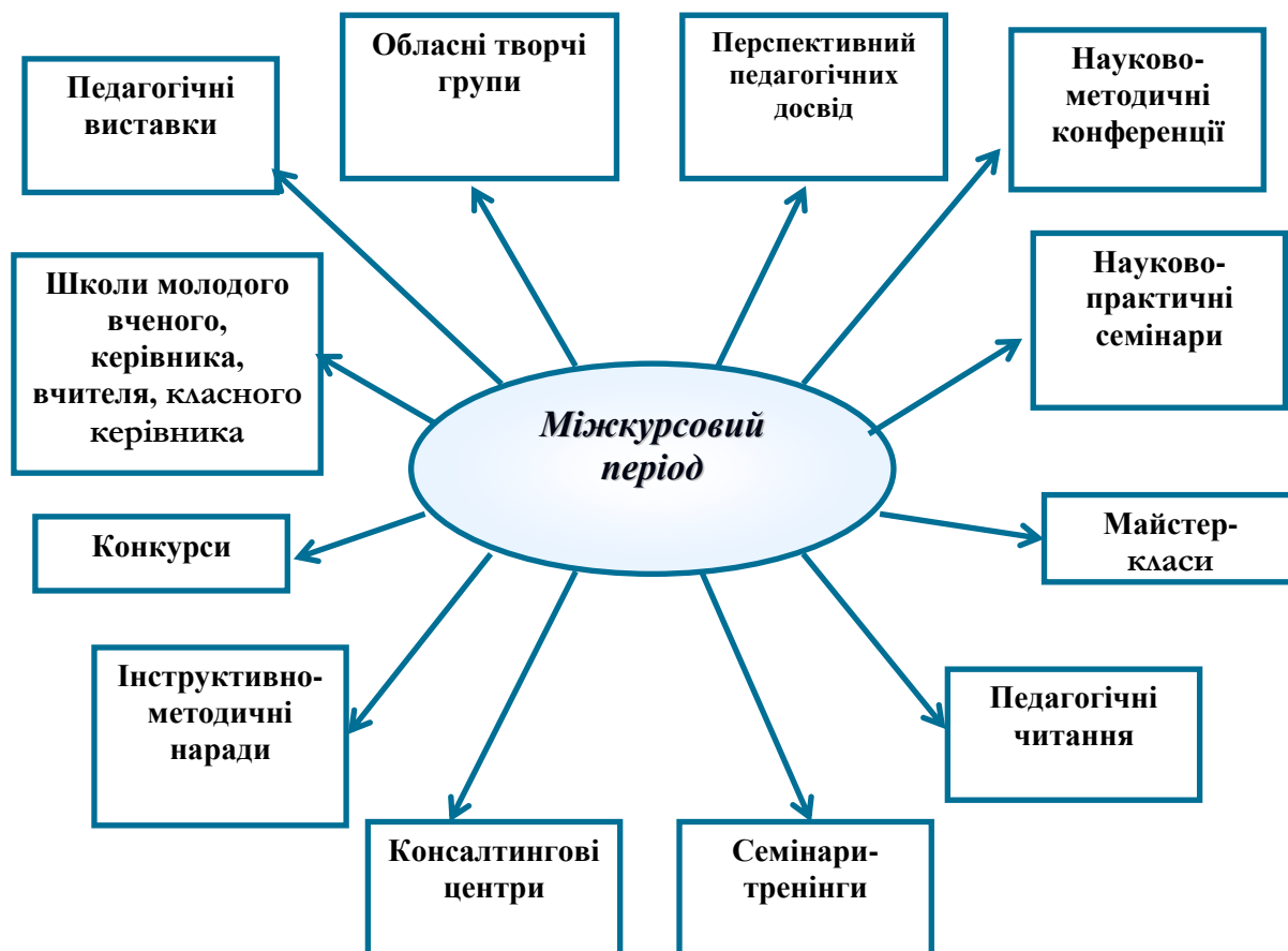
Рис. 4.1. Діяльність районних (міських) методичних кабінетів у міжкурсний період

Для завідувачів районних (міських) методичних кабінетів постійно діє семінар із теми «Науково-методичні шляхи підвищення якості й ефективності фахової майстерності та компетентності керівників освітніх закладів».