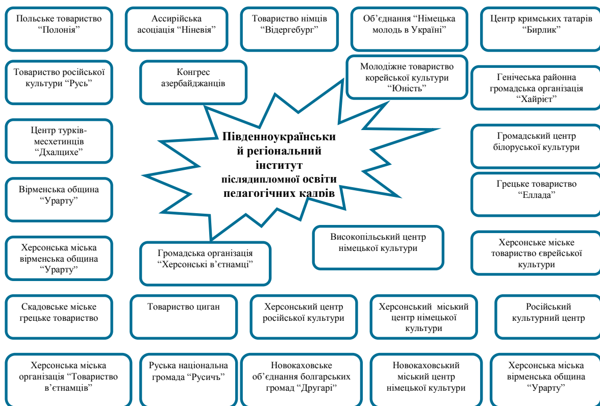
Рис. 4.4. Співпраця Південноукраїнського регіонального інституту післядипломної освіти педагогічних кадрів з громадськими організаціями національних меншин

«Хесед Шмуель», обласним польським товариством «Полонія», «Херсонською міською громадською організацією «Руська національна громада «Русичь», вірменською обласною організацією «Урарту», Херсонським міським центром німецької культури, Херсонським товариством греків «Еллада», Генічеським районним культурно-просвітницьким центром кримських татар «Бирлик».