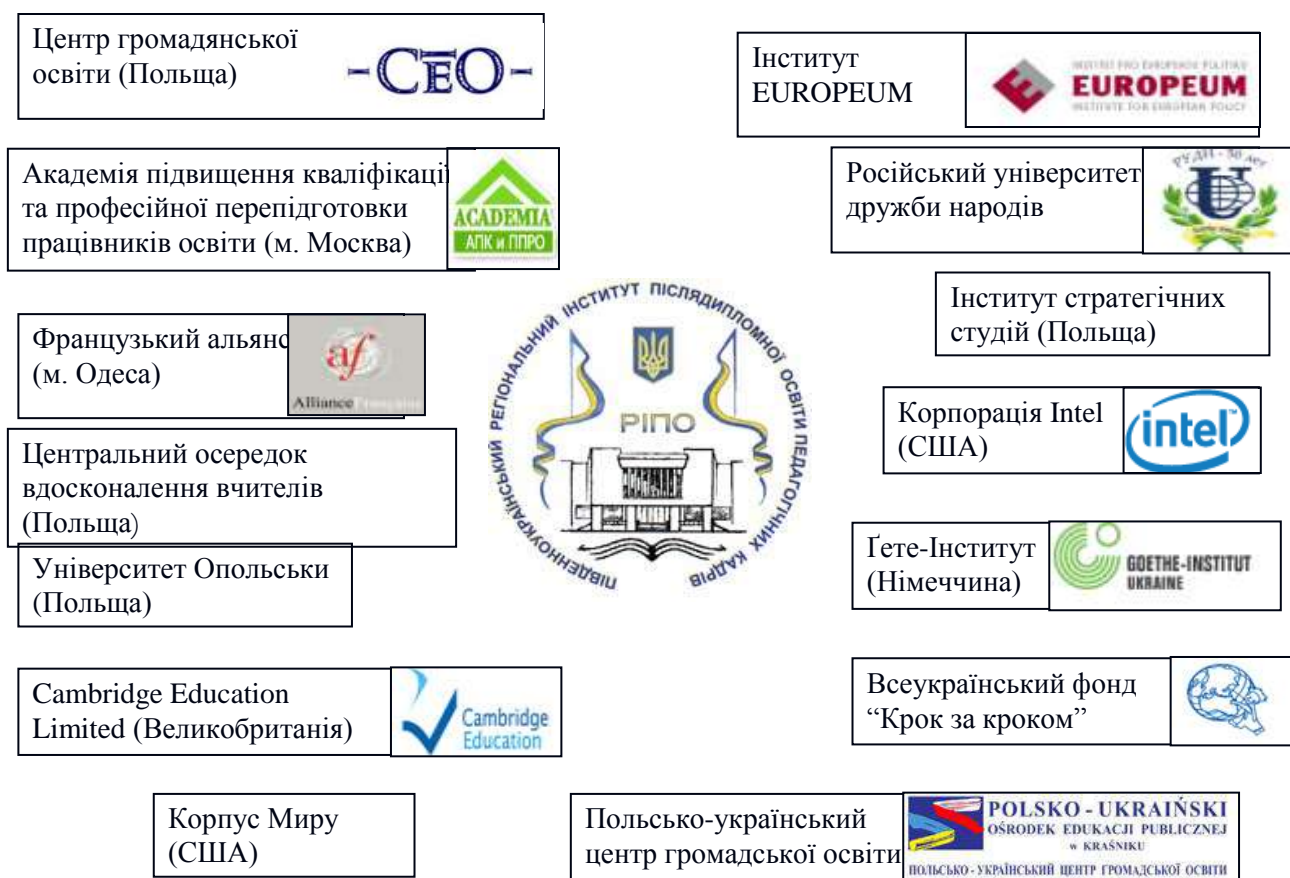
Рис. 4.5. Співпраця інституту з міжнародними установами та організаціями

На даний час інститут працює у 15 міжнародних програмах і проектах.