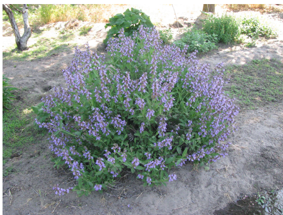
Рис. 1. Salvia officinalis L. – Шавлія лікарська.