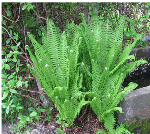
Рис. 2. Thelypteris palustris Schott – Теліптерис болотяний, папороть болотяна.

Rosa odorata (Andrews) Sweet. – Троянда чайна. Rudbeckia laciniata L. – Рудбекія роздільнолиста. Rudbeckia hirta L. – Рудбекія шершава. Rudbeckia fulgida Aiton – Рудбекія блискуча, або рудбекія промениста, «Золота куля». Sedum spurium M.Bieb. – Очиток несправжній. Scilla bifolia L. Проліска дволиста. Вид занесений до Червоного списку Херсонської області [ВОЙКО, РОДНАЙНИ, 2002]. Solidago virgaurea L. – Золотушник звичайний. Tagetes erecta L. – Чорнобривці прямостоячі, повняки. Thelypteris palustris Schott – Теліптерис болотяний, папороть болотяна.