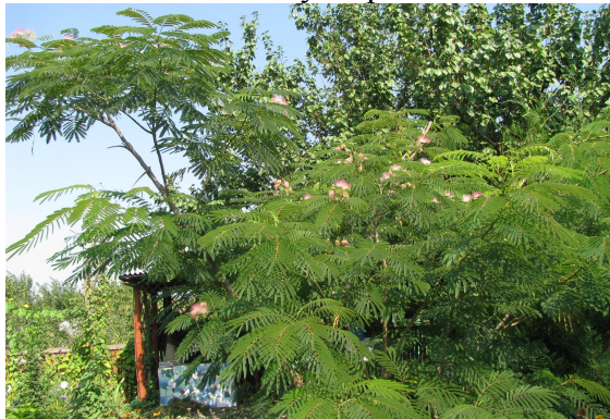
Рис. 4. Albizia julibrissin Durazz. – Альбіція ленкоранська.

Albizia julibrissin Durazz. – Альбіція ленкоранська. Підмерзає кожної зими, дуже підмерзла взимку 2005 р., але поновлюється і утворює багато квітів.