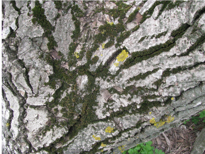
Рис. 8. Мох Orthotrichum pumilum Sw. – Прямоволосник карликовий та лишайники Physcia adscendens (Fr.) H. Olivier і Xanthoria parietina (L.) Th. Fr. на корі стовбура горіха грецького.

Lecanora albescens (Hoffm.) Flörke – на вапнякових каменях.