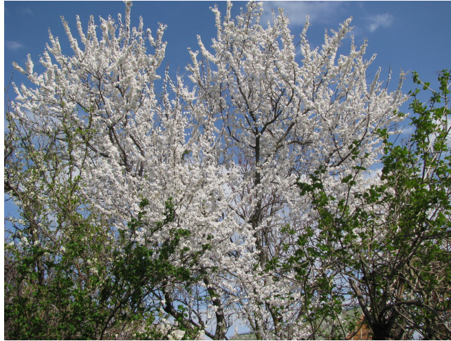
Рис. 7. Prunus divaricata Leseb. – Алича.