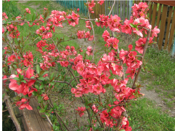
Рис. 6. Chaenomeles speciosa (Sweet) Nakai – Хеномелес японська.