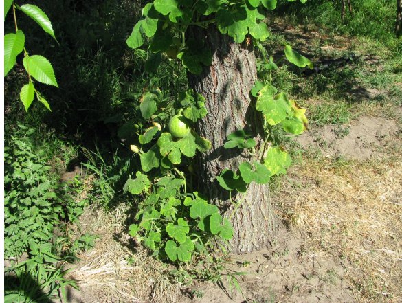
Рис. 3. Cucurbita ficifolia Vouche – Гарбуз фіголистий.