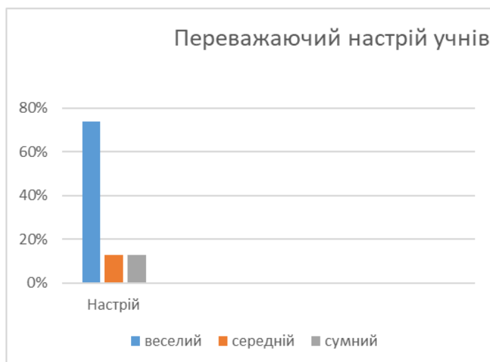
Рис.2. Результати анкетування щодо переважаючого настрою серед учнів