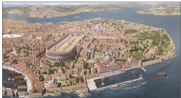
Huge arena known as the Hippodrome

Constantinople, the imperial capital, viewed itself not only as the center of a world empire but also as a special Christian city. The inhabitants believed that the city was under the protection of God and the Virgin Mary. One thirteenth-century Byzantine said: «About our city you shall know: until the end she will fear no nation whatsoever, for no one will entrap or capture her, not by any means, for she has been given to the Mother of God and no one will snatch her out of Her hands. Many nations will break their horns against her walls and withdraw with shame». The Byzantines saw their state as a Christian empire [5, c. 364].