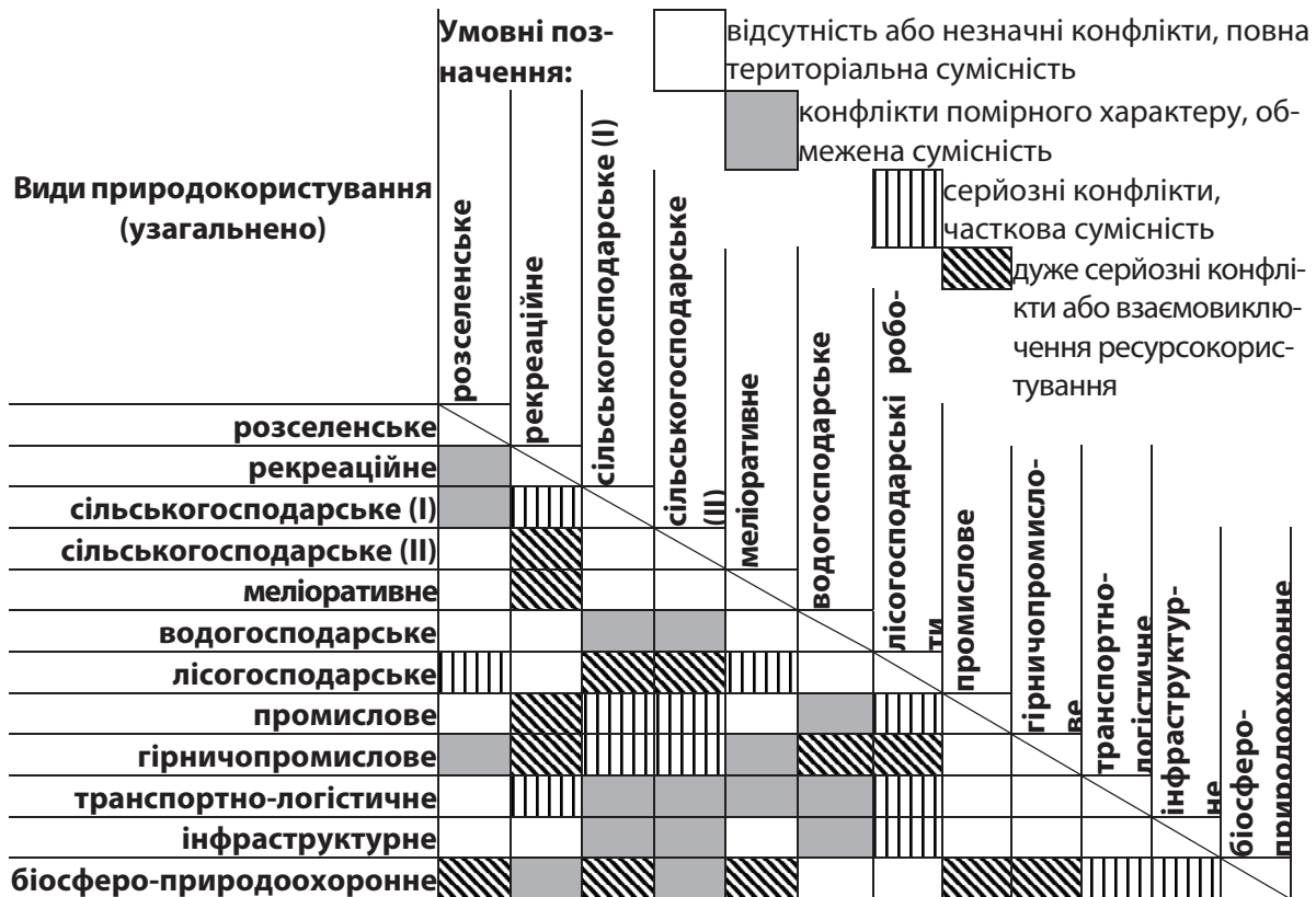
Рис. 1. Конфліктні ситуації та територіальна сумісність/несумісність відповідних різновидів природокористування

Узагальнена номенклатура (на прикладі Херсонського регіону) виділених для зіставного аналізу видів природокористування є такою: