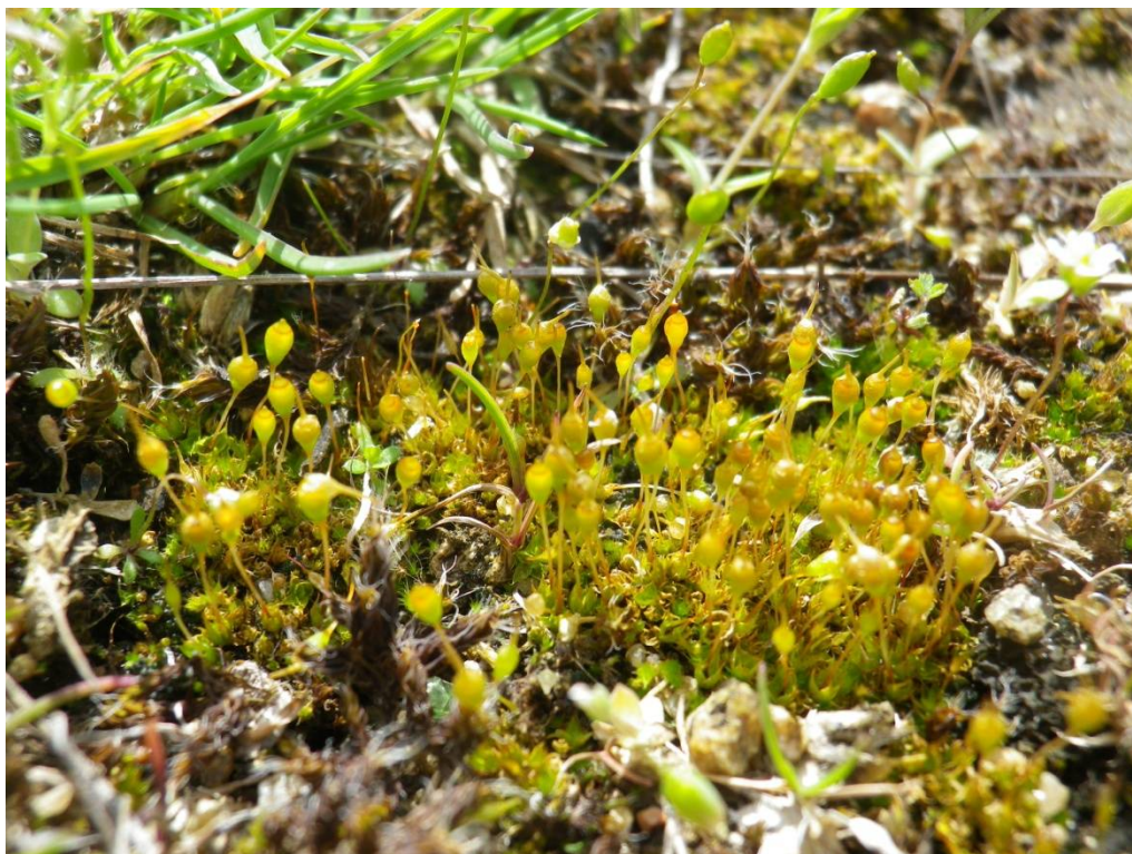
Рис. 4. Мох Physcomitrium arenicola Lazarenko на дрібній гранітній жорстві біля відслоненої горизонтальної гранітної брили.