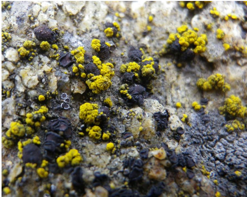
Рис. 3. Candelariella vitellina (Hoffm.) Müll. Arg. та Sarcogyne privigna (Ach.) A. Massal. на вертикальних стінках гранітних відслонень.

У більш мезофітних умовах, на скелях, що безпосередньо виходять до русла річки видовий склад доповнюють Athallia holocarpa (Hoffm.) Arup, Frödén & Søchting та Scoliciosporum umbrinum (Ach.) Arnold.