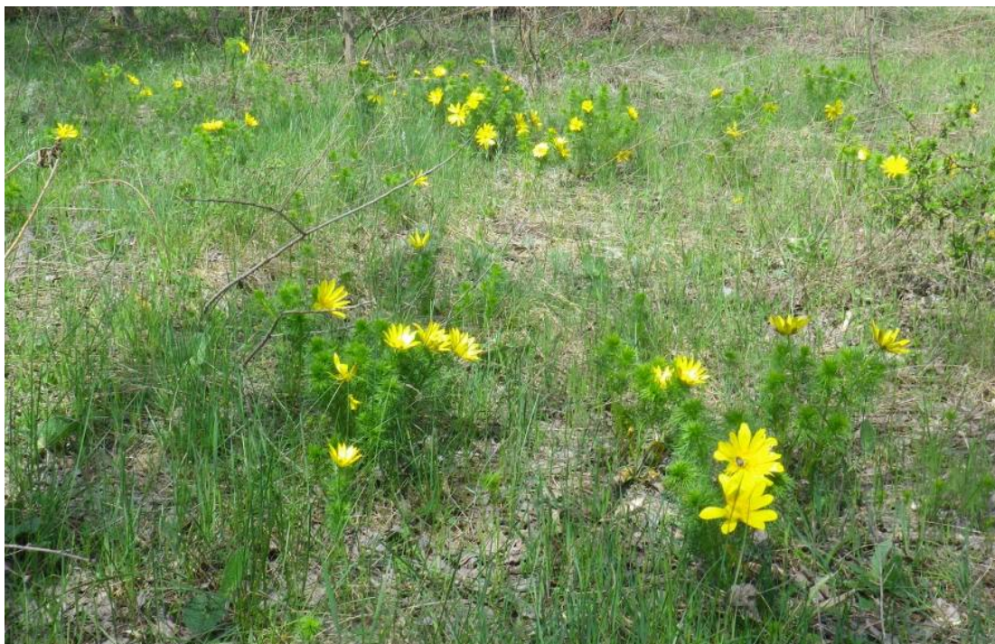
Рис. 2. Adonis vernalis на узліссі.

Представником раритетної флори є Adonis vernalis L., який зростає в лісових посадках та біля них на узліссях в досить великій кількості (рис. 2).