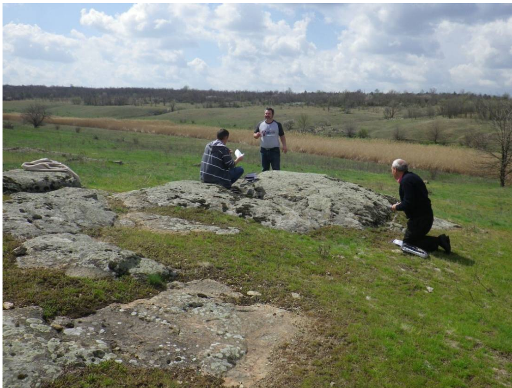
Рис. 1. Відслонення гранітів в околицях с. Водяно-Лорине.