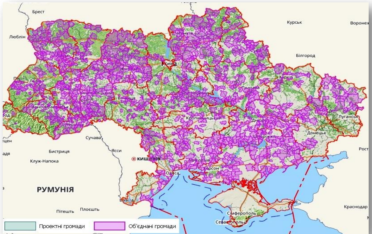
Рис 1. Динаміка об'єднаних територіальних громад в 2017 році Миколаївської області

Місцевій владі надаються повноваження, та фінансування на їх реалізацію. Завдяки ефективному використанню бюджетних коштів, створення власних представницьких органів, процесам інвентаризації та оптимізації наявних ресурсів, всі існуючі громади Миколаївщини визнано фінансово спроможними.