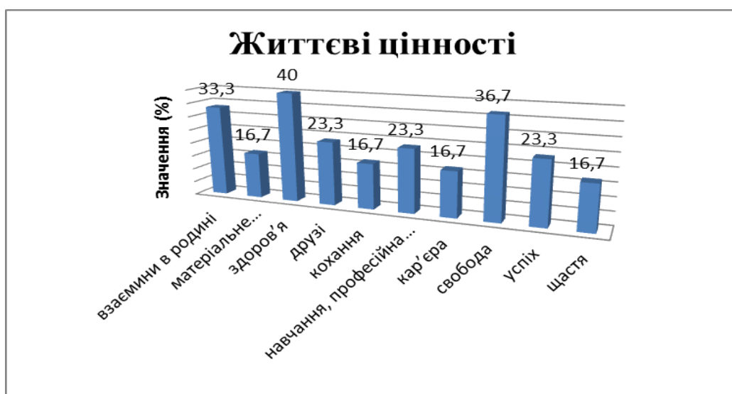
Рис 2.1. Ранжування життєвих цінностей старшокласниками за авторською анкетною

На 1 місце поставили здоров'я, на 2 – взаємини в родині, на 3 – навчання, професійна освіта, на 4 – успіх, на 5 – матеріальні блага, на 6 – щастя, на 7 – кар'єра, на 8 – кохання, на 9 – друзі, на 10 – свобода.