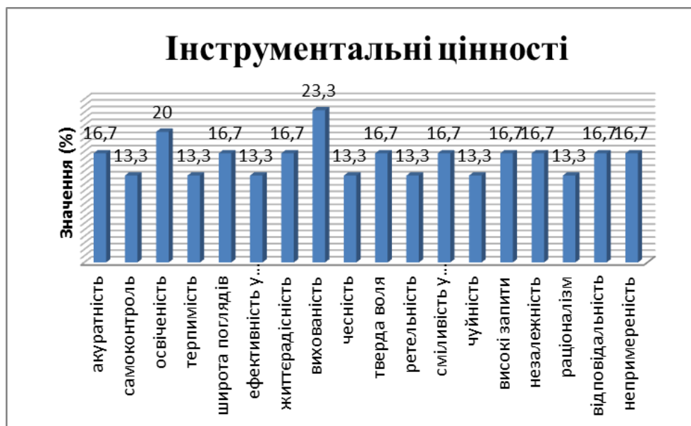
Рис 2.3. Найбільш важливі інструментальні цінності сучасних старшокласників

категорії: життєрадісність, високі запити, акуратність, відповідальність, тверда воля, незалежність, широта поглядів, сміливість у відстоюванні своєї думки, непримиренність до недоліків в собі й інших. Найменш значущими цінностями для підлітків виявилися самоконтроль, раціоналізм, терпимість, ефективність у справах, ретельність, чесність, чуйність їх обрало 13,3 %.