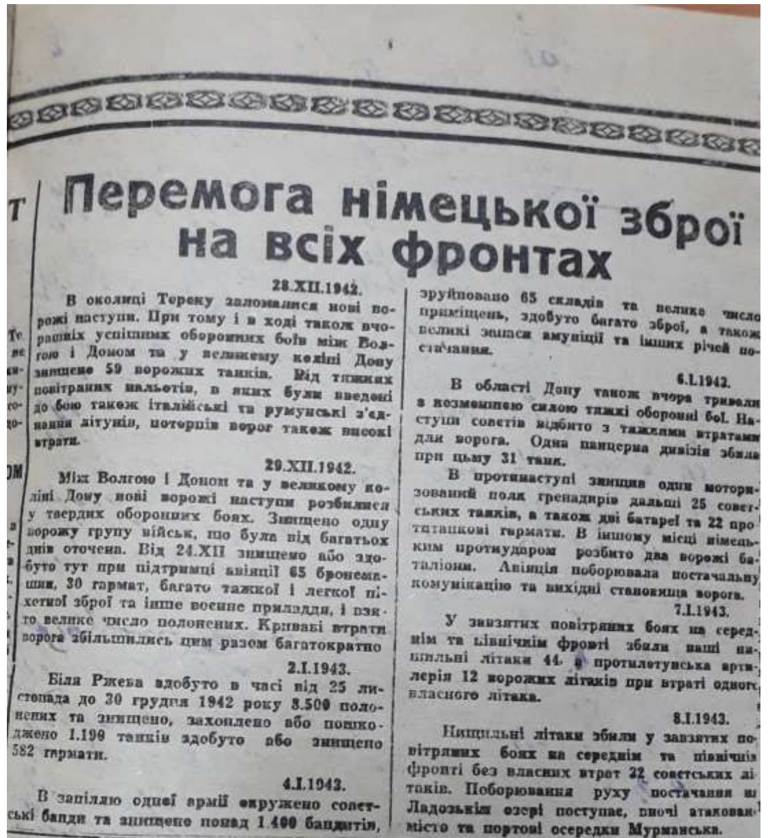
Рис. Д. 1. Один із прикладів німецької агітації в Сиваському.