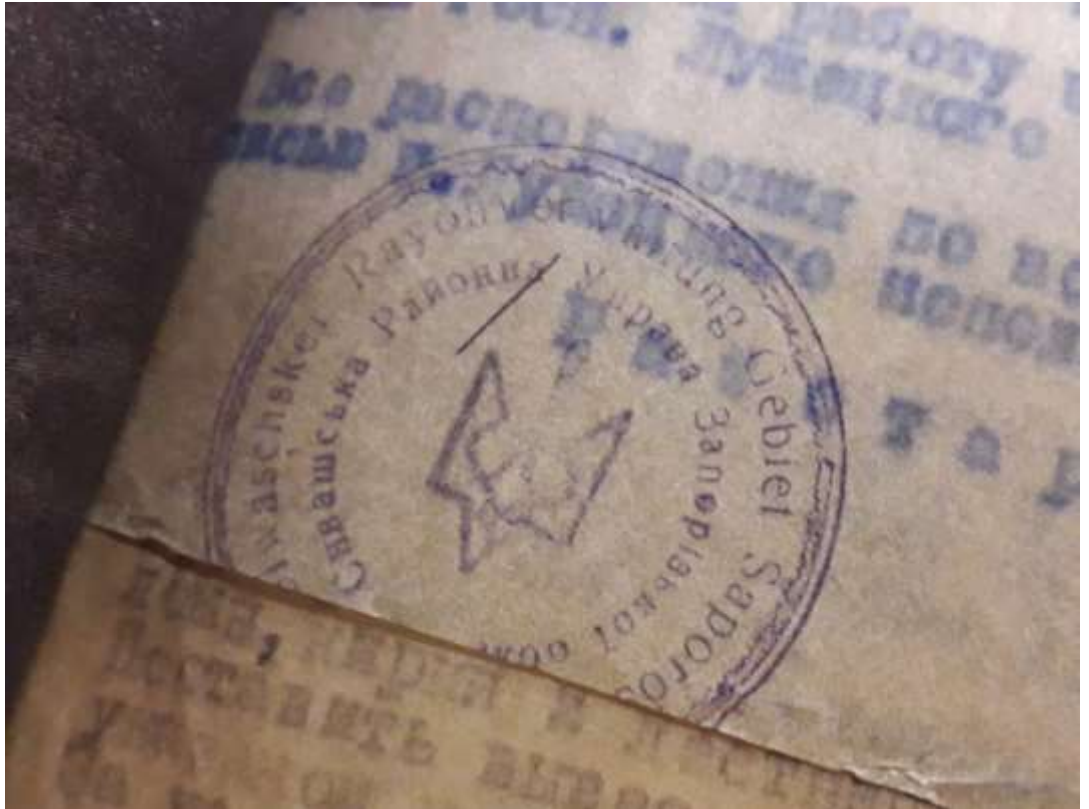
Рис. В. 1. Печатка Сиваської районної управи Запорізької області періоду гітлерівської окупації.