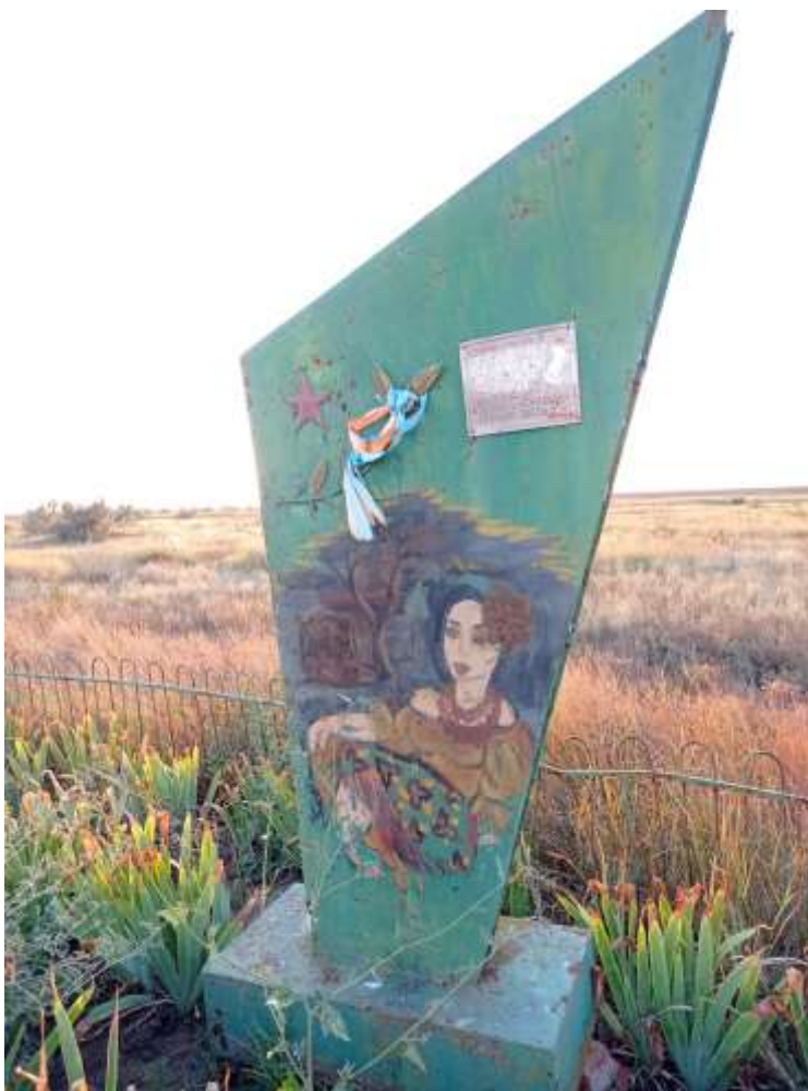
Рис. Ж. 1. Пам'ятник на місці розстрілу ромів 6 травня 1942 р.