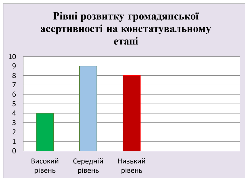
Рисунок 2.1 – Рівні розвитку громадянської асертивності учнів на констатувальному етапі.

У результаті діагностики 2 класу ми встановили: