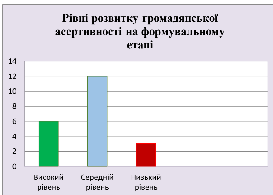
Рисунок 2.2 – Рівні розвитку громадянської асертивності учнів на формувальному етапі.

Анкетування на формувальному етапі проводилося з метою повторної діагностики та визначення рівня розвитку громадянської асертивності в учнів класу на завершення нашого дослідження. Отримані результати наводимо на рисунку 2.2