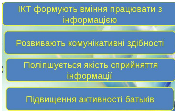
Рис.1.2.-Роль ІКТ у роботі з батьками

Відносно використання ІКТ для налагодження співпраці родини і закладу дошкільної освіти, ми розглядаємо електронну пошту, сайт, месенджери як інструментарій такої взаємодії. Попри свою зайнятість, можливість аби переглянути свою електронну пошту час завжди можна