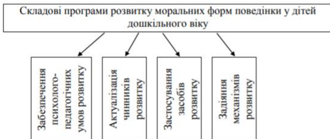
Рис 2.2. Напрями розвитку моральних форм поведінки у дітей дошкільного віку

Як видно, провідним видом діяльності є навчально-ігрова, яка включає в себе всі елементи корекційно-діагностичної роботи. Беззаперечно, вдалий і методично обґрунтований інструментарій педагогів, організоване розвивальне середовище, врахування сімейних умов, в яких виховується дитина і тісна співпраця з родиною дозволяє вирішити проблеми формування моральних норм у дошкільника [25]. Завдання, які постають перед педагогічним колективом і батьками є різноманітними і враховують наукові пошуки психолого-педагогічної науки (рис.2.3).