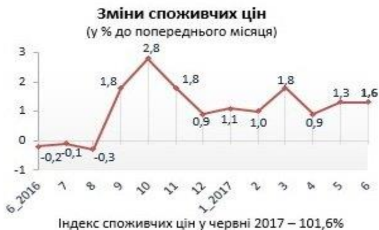
Рис. 2.1. Індекс споживчих цін

Звичайно, збір споживчих кошиків - це умовний збір, який буде прийнятий при розрахунку багатьох економічних показників. Особливо рівень виживання. Очевидно, що чим краща якість споживчого кошика, тим вищий економічний добробут суспільства. [двадцять чотири]. З роками показники індексу інфляції наочно ілюструють зміни цього значення та способи прогнозування майбутнього.