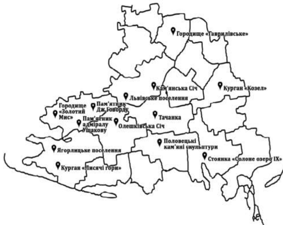
Мал. 1. Основні об'єкти культурної спадщини Херсонської області національного значення, які занесені до Державного реєстру нерухомих пам'яток України

Херсонський регіон багатий на курортно-рекреаційні ресурси. Перш за все, це морські пляжі, солоні озера, родовища лікувальних грязей, лікувальні термальні води на Арабатській Стрілці. А також, як вже зазначалося, область має більше 5 тисяч історико-культурних об'єктів, якими нам слід пишатися (мал.1).