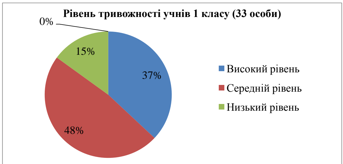
Рисунок 2.1.2 – Рівень тривожності учнів 1 класу

Підсумки нашого дослідження сигналізують про те, що, в основному, діти мають середній рівень тривожності. Але викликає занепокоєння той факт, що велика кількість учнів мають надмірну емоційну збудженість, у багатьох спостерігається різка полярність емоційних станів та перепади настрою. У деяких молодших школярів спостерігається тенденція «переносити» негативні моменти життя родини на способи взаємодії у класі. Отримані результати дослідження ми відобразили у формі діаграми Рисунок 2.1.2.