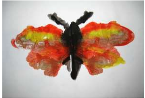
Рисунок 2.2.1 – Кляксографія

Ще одним, добре відомим видом монотипії є «кляксографія». Її техніка полягає в тому, що лист згинається навпіл, потім розкладається на столі. З одного боку згину хаотично або у вигляді конкретного зображення наносяться плями фарби. Можна нанести фарбу біля лінії згину, або в іншій частині листа – від цього залежатиме, ступінь злиття оригіналу і майбутнього відбитку в одне ціле або як два різні зображення. Потім лист знову згинається та міцно притискається рукою. Як наслідок, фарба симетрично передається на іншу половину аркуша. У результаті отримуємо новий витвір мистецтва [11].