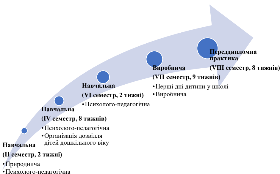
Рис. 1.2. Види педагогічних практик