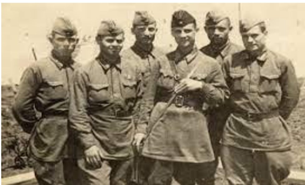
Курсанти Херсонської авіашколи, червень 1941 р