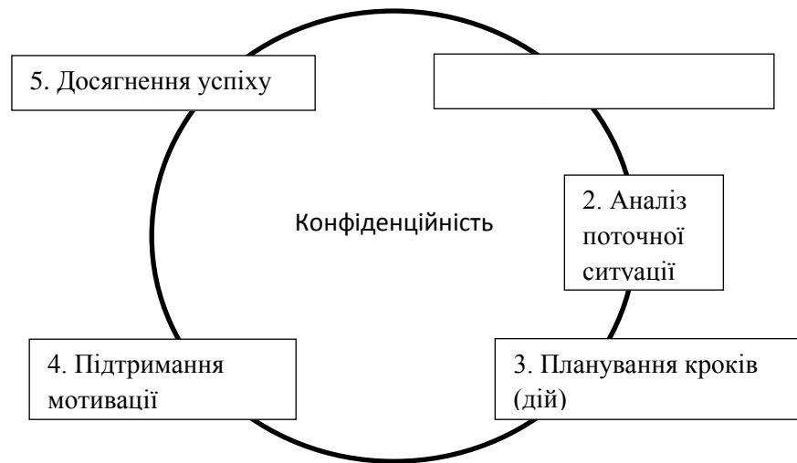
Рис. 3.1. Процес коуч-консультування

На кожному етапі коучингу відбувається процес навчання. Коуч фактично вчить клієнта звертатися до внутрішніх джерел знання і енергії – уяви, самосвідомості, пам'яті, глибинним цінностям і свободі волі. Крім цього, він також передає клієнту певні спеціальні знання і навички, особливо в області комунікації, планування, лідерства та емоційного інтелекту. Таким чином, в ході коучингу клієнт (та й коуч теж) постійно відчуває відчуття нових відкриттів і звершень.