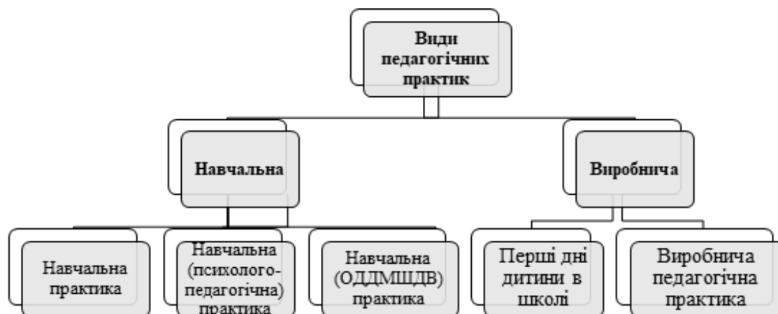
Рис. 1. Види педагогічних практик Херсонського державного університету педагогічного факультету

Навчальна (психолого-педагогічна) практика здобувачів здійснюється на другому та третьому курсах навчання. Організовується такий вид навчальної практики на базах закладів загальної середньої освіти, з якими керівництво факультету уклало угоду про співпрацю. На другому курсі відповідно до навчального плану на цей вид практики відведено 1,5 кредиту ЄКТС, що становить 45 годин. Тривалість психолого-педагогічної практики становить один тиждень. На третьому курсі здобувачі