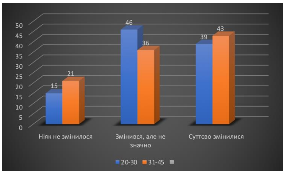
Рис.2.4. Гістограма показників за віком.

2.2. За віком: респонденти віком від 20 до 30 – 15% дали відповідь «ніяк не змінився»; 46% дали відповідь «змінився, але не значно»; 39% дали відповідь «суттєво змінилося». Респонденти віком від 31 до 45 – 21% дали відповідь «ніяк не змінився»; 36% дали відповідь «змінився, але не значно»; 43% дали відповідь «суттєво змінилося». Графічне зображення представлено на рисунку 2.4.