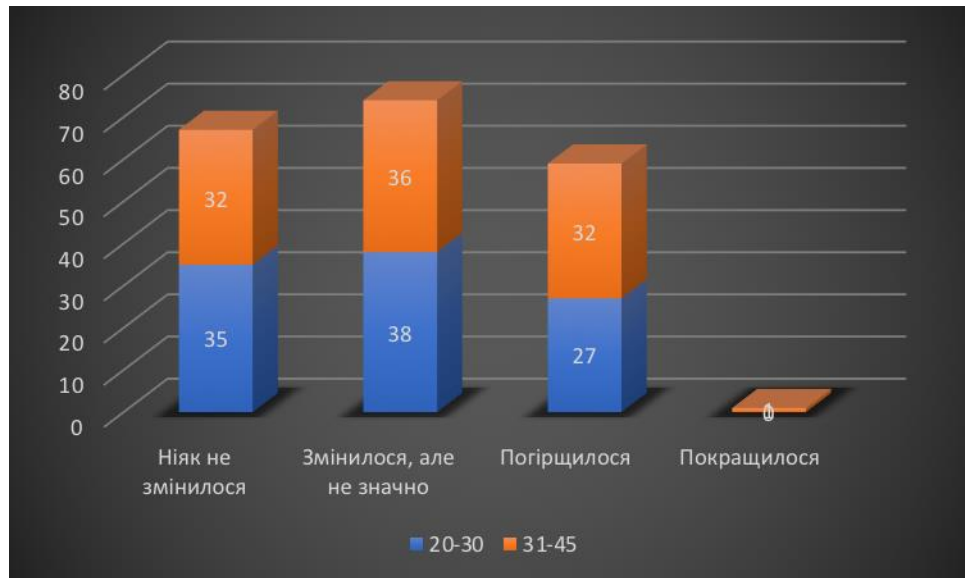
Рис.2.3. Гістограма показників за віком

«погіршився»; 0% дали відповідь «покращилося». Графічне зображення представлено на рисунку 2.3.