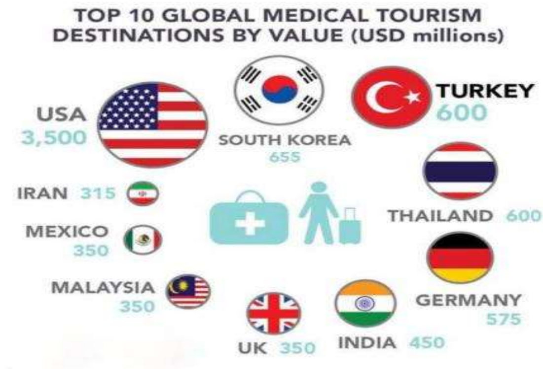
Рис 2.1 Медичний туризм в цифрах

За даними досліджень, ринок медичного туризму у 2020 році становив $44,8 млрд. Це означає, що таку суму витратили пацієнти, які виїхали на лікування за кордон. Західним країнам є що запропонувати іноземним пацієнтам [15]. Незважаючи на високу вартість, Японія, США, Великобританія, Німеччина та Франція мають високі технології та відмінно підготовлений, мотивований персонал, а також в цілому більш жорстко дотримуються стандартів якості та безпеки. Заможні медичні туристи з країн, що розвиваються, обирають саме ці напрямки, оскільки вдома їм не можуть запропонувати гідного лікування.