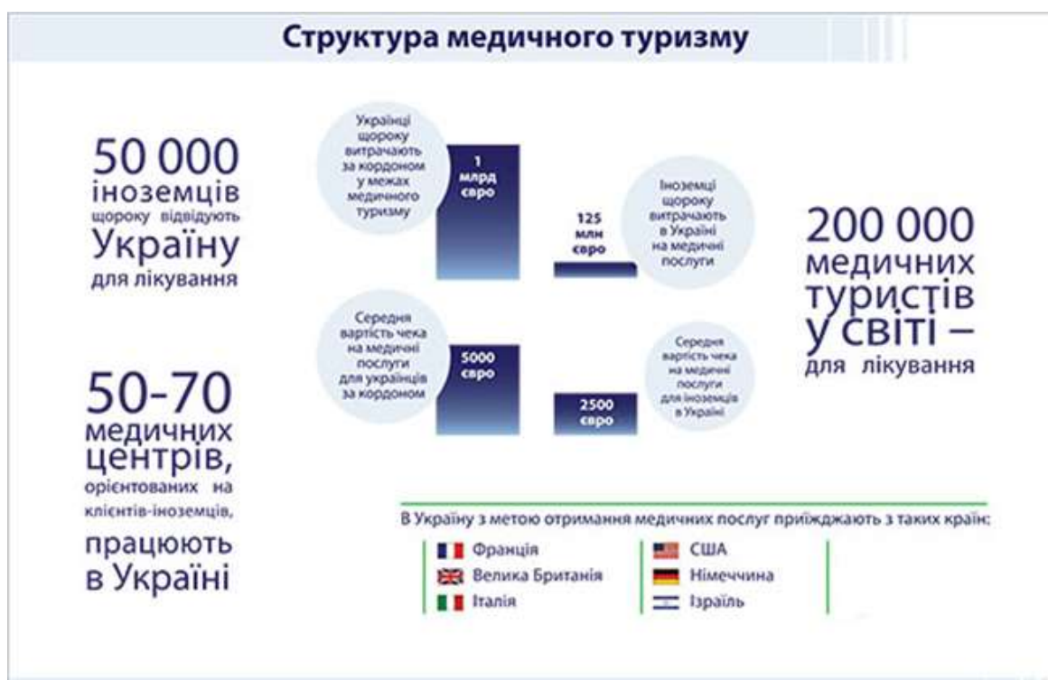
Рис 1.2 Структура медичного туризму

Найпопулярніші напрямки для в'їзного медичного спеціалізованого туризму. Медичний туризм в Україні розвивається семимильними кроками. Відкриваються провайдерські компанії та сервісні відділи, орієнтовані іноземного пацієнта [32]. Окрім безпосередньої організації відпочинку та оздоровлення, все більше компаній пропонують мандрівникам медичний туризм. Лікувальні установи вдосконалюють сервіс та розробляють прозору, легальну фінансову модель роботи з іноземними пацієнтами.