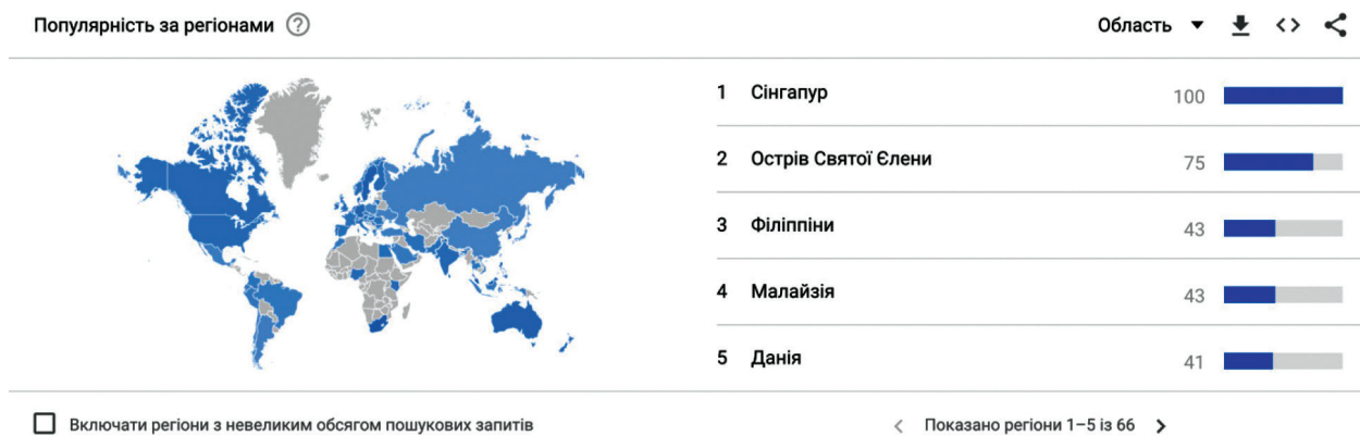
Рис. 2. Країни з найвищим показником пошуку інформації щодо гейміфікації [17]

цього феномену. Насамперед переклад з англійської “gamification” трактує цей термін як «використання гри механіки в неігрових контекстах» (Детердінг, Діксон, Халед і Наке, 2011), тобто використання підходів, які застосовуються під час проектування комп'ютерних ігор для вирішення різних завдань неігрових процесів. «Гейміфікація» як термін виник у індустрії цифрових медіа і вперше був використаний ще у 2002 році розробником популярних відеоігор Ніком Пелінгом, який відкрив консультативну компанію для створення ігрових інтерфейсів для електронних пристроїв [16].