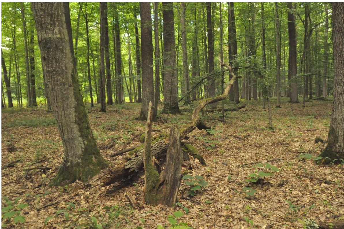
Рис. 1. Лісові біотопи Ківерцівського національного природного парку «Думанська пуща». Fig. 1. Forest habitats of Kivertsi National Nature Park «Tsumanska Pushcha».