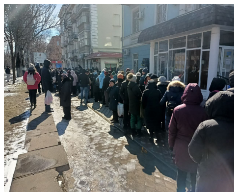
Рис. 3. Зникнення товарів першої необхідності і черги до продуктових магазинів (фото: Д. Мальчикова, 12 березня 2022 року)