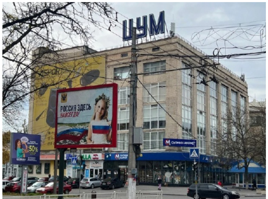
Рис. 5б. «Окупація почуттів» і зміна міської ідентичності (джерело: https://www.kp.ru/daily/27463/4668757/ , 27 жовтня 2022 року; * На місці супермаркету «Сільпо» (Херсон, проспект Ушакова) відкрито російський супермаркет «Сытный маркет»)