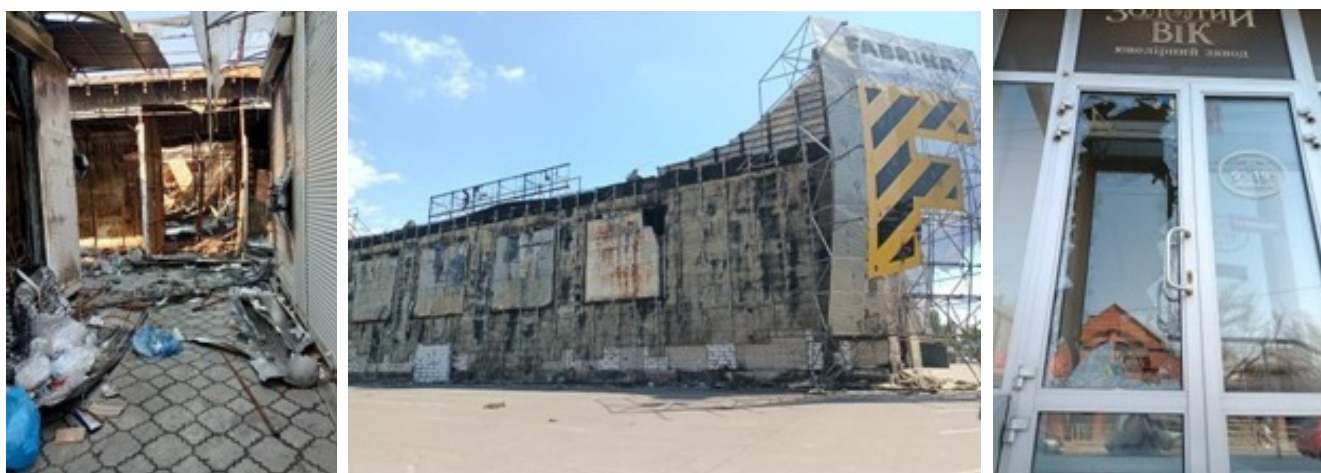
Рис. 2. Прямий урбіцид в результаті військового силового захоплення міста (фото: Д. Мальчикова, березень 2022 року)

В умовах, коли вже за перші 5 днів силового захоплення міста і впродовж всього наступного періоду окупації була фактично повністю