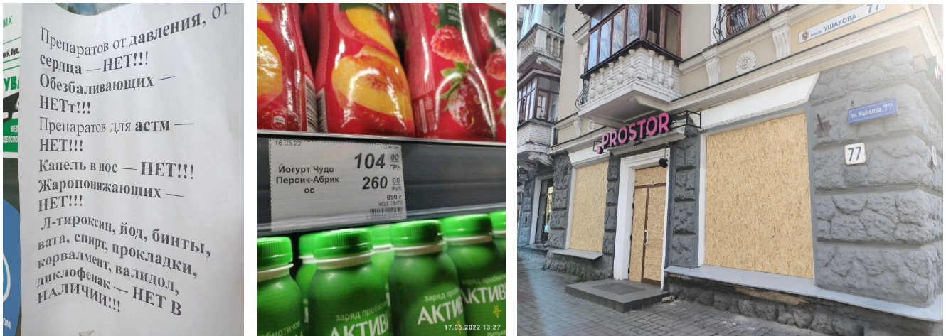
Рис. 4. Стан наявності медикаментів (фото з вітрини аптеки), цінова політика російського супермаркету і припинення діяльності мережевого українського мас-маркету (фото: Д. Мальчикова, травень 2022 року)