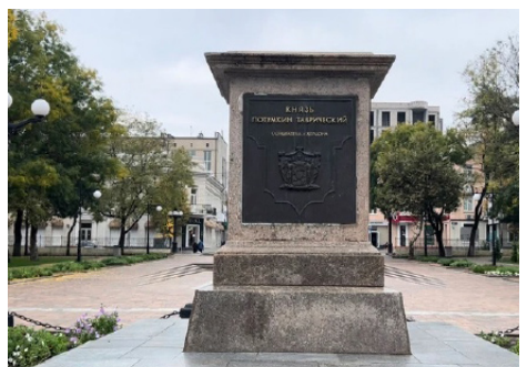
Рис. 6. Викрадені російськими окупантами пам'ятники Федору Ушакову, Олександрові Суворову та Григорію Потьомкіну