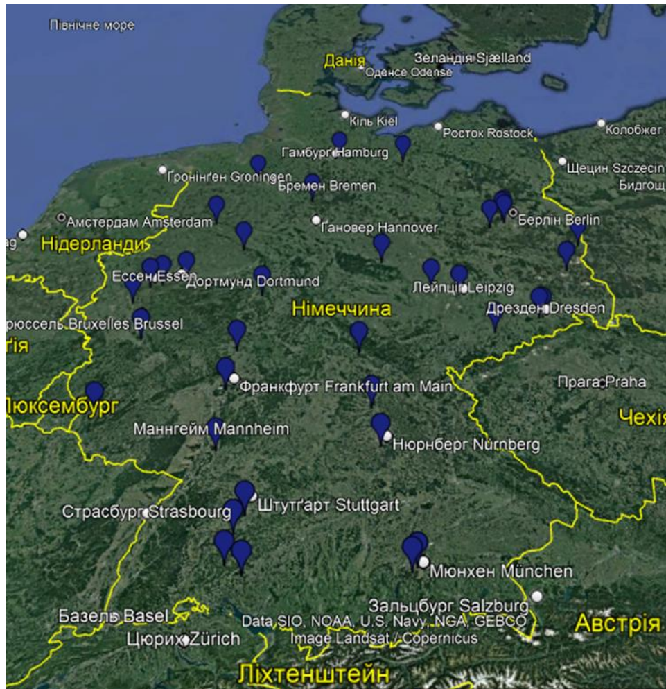
Рисунок 1.1. Розподіл Центрів прийому біженців по території Німеччини [8]

довгий термін у місті скоріше за все їх за розподілом залишать у столиці. За умови розподілу до іншої федеральної землі дістатися до місця призначення можна буде безкоштовно.