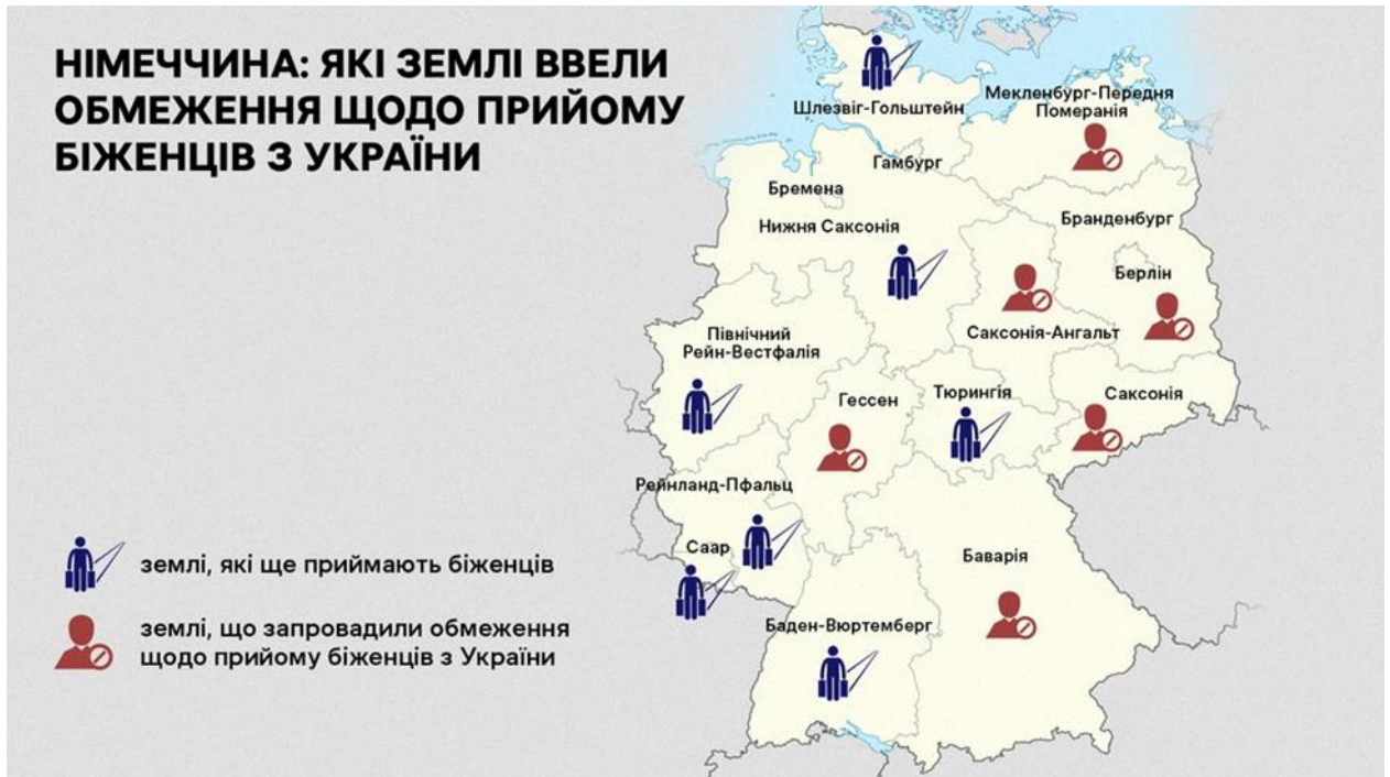
Рисунок 1.2. Обмеження прийому біженців із України за федеральними землями Німеччини [7]

Такими землями є Гессен, Баварія, Гамбург, Бранденбург, Саксонія, Саксонія-Ангальт та Мекленбург-Передня Померанія. Однак такі повідомлення не означають, що більшість із федеральних земель взагалі не зможе прихистити біженців. Мова іде лише про припинення прийому за системою первинного розподілу (коли особа, прибувши до країни, не має конкретного місця де вона могла би зупинитися). Відповідно, якщо земля, до якої прибув біженець, вичерпала свою квоту, то вона може ініціювати його перерозподіл до іншої землі. Координація між землями у даному питанні відбувається за посередництва федерального міністерства внутрішніх справ у Берліні [7].