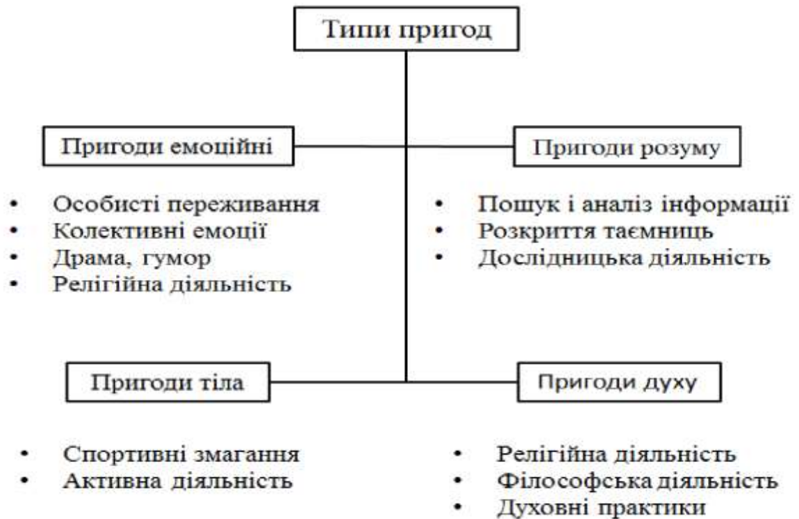
Рис. 2. Типологізація пригод [3].

Спробуємо виокремити види пригод, які пропонує пригодницький туризм, виходячи з потреб сучасних споживачів (рис. 2):