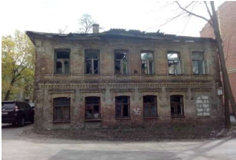
Рис. Д. 1. Родинний маєток Ковалівських в м. Харкові. В цьому будинку жили Соснові напередодні і в роки Другої Світової війни. Фото О. Салтана, 2018 р [53].