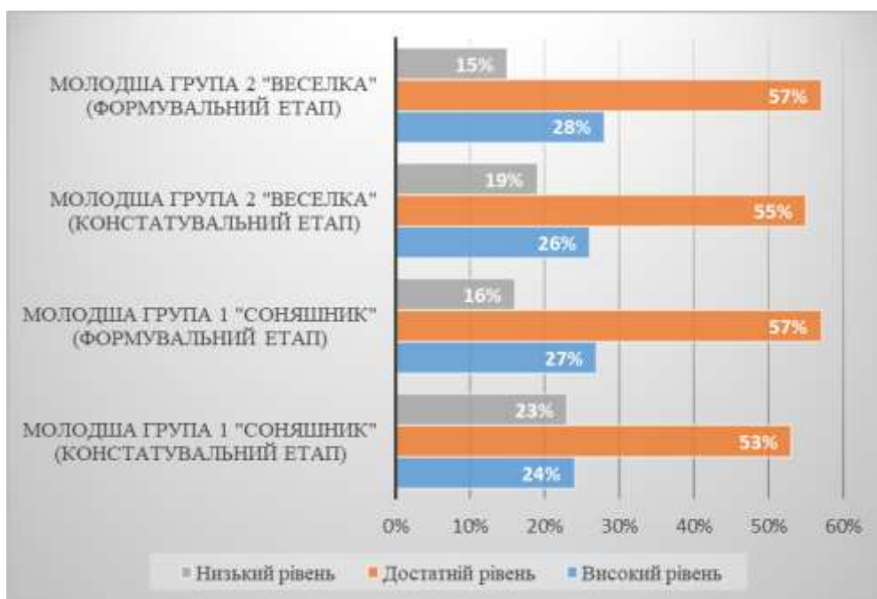
Рис. 2.4 Порівняльні результати стану сформованості готовності членів родин дошкільників до спільної роботи з педагогічним колективом ЗДО (констатувальний та формувальний етапи)

представлені порівняльні результати стану сформованості готовності членів родин дошкільників до спільної роботи з педагогічним колективом ЗДО.