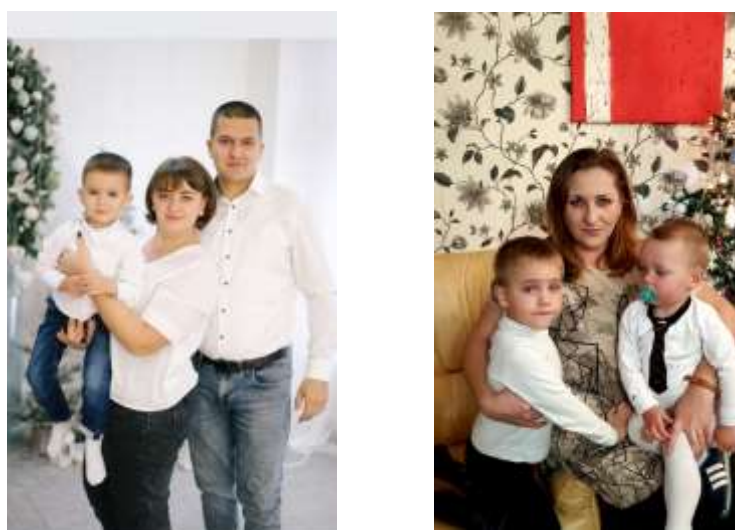
Рис. 2.3 Фотовиставка до Дня сім'ї

Фотовиставка до Дня сім'ї. Метою фотовиставки до Дня сім'ї (рис. 2.3) було залучення уваги громадськості до ролі та важливості сімейних цінностей, а також підтримка та підвищення якості сімейного життя. Ця ініціатива важлива для зміцнення сімей та підтримки їхнього благополуччя.