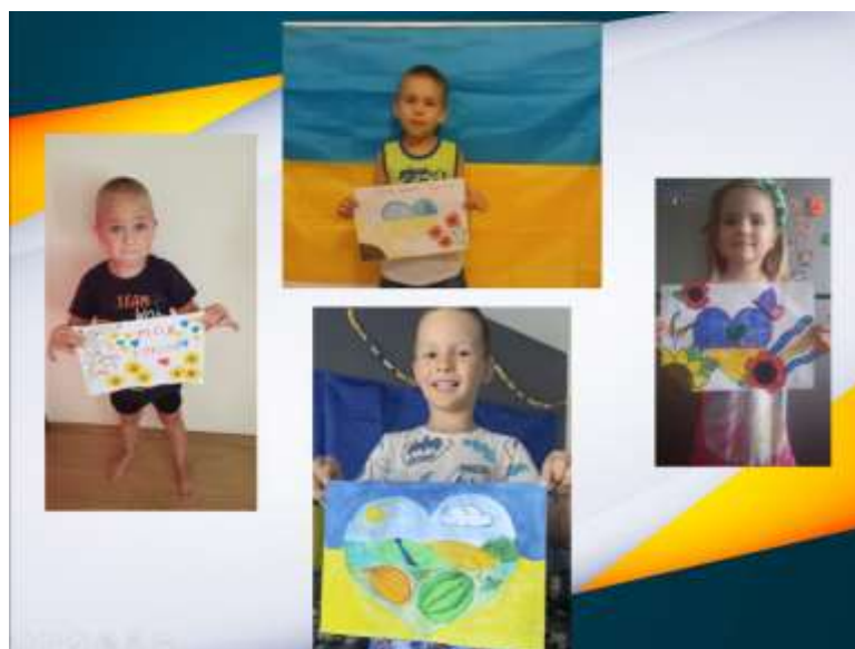
Рис. 2.1 Акція «Повернися живим!» малюнки дітей воїнам ЗСУ

Наприклад, акція «Повернися живим!» стала чудовою ініціативою, яка дозволила дітям висловити свою підтримку та вдячність воїнам Збройних Сил України. Малюнки дітей (рис. 2.1), на яких вони виражають свої побажання та надії на безпеку та щасливе повернення воїнів, мають велике значення. Це не лише вираз мистецького таланту маленьких авторів, але і символічний спосіб підтримки та солідарності.