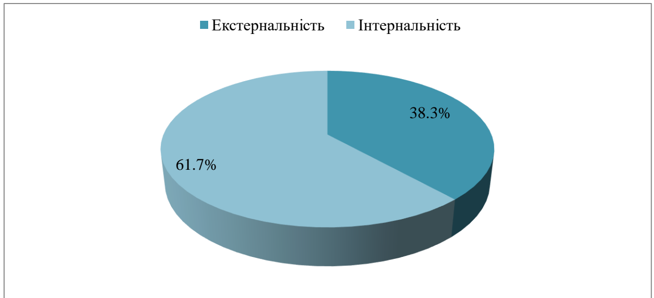
Рис. 2.5. Загальні показники екстернальності-інтернальності

Аналізуючи отримані показники та узагальнюючи їх за різними сферами життя молоді, нами було визначено загальні результати прояву екстернальності-інтернальності, що представлено на рисунку 2.5.