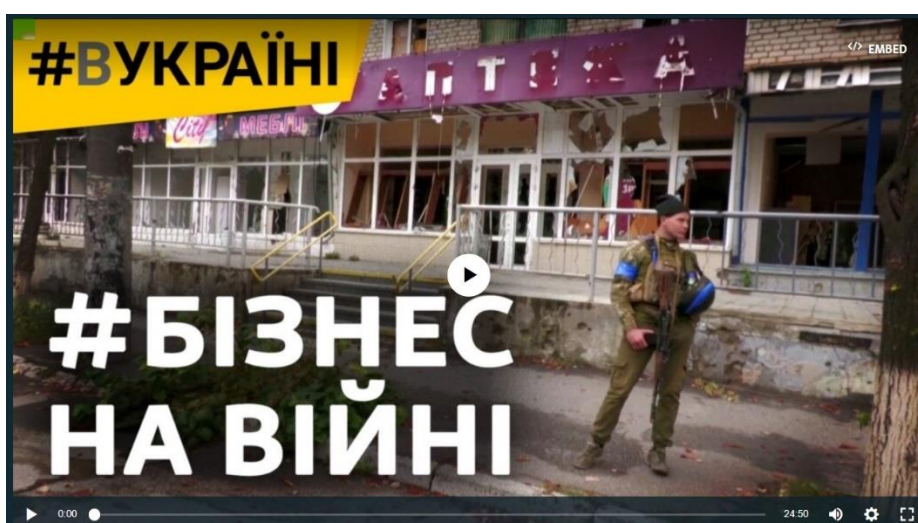
Рис. 2.1 Випуск «Бізнес на війні: як виживають підприємства в окупації»

«#ВУкраїні» – проєкт про людей, про унікальні місця та про боротьбу українців за свої права. Перші випуски присвячені темі війни з’явилися в жовтні 2022 року. Зокрема, 4.10.22 був опублікований сюжет про те, як виживають підприємства в окупації – «Бізнес на війні: як виживають підприємства в окупації» [1].