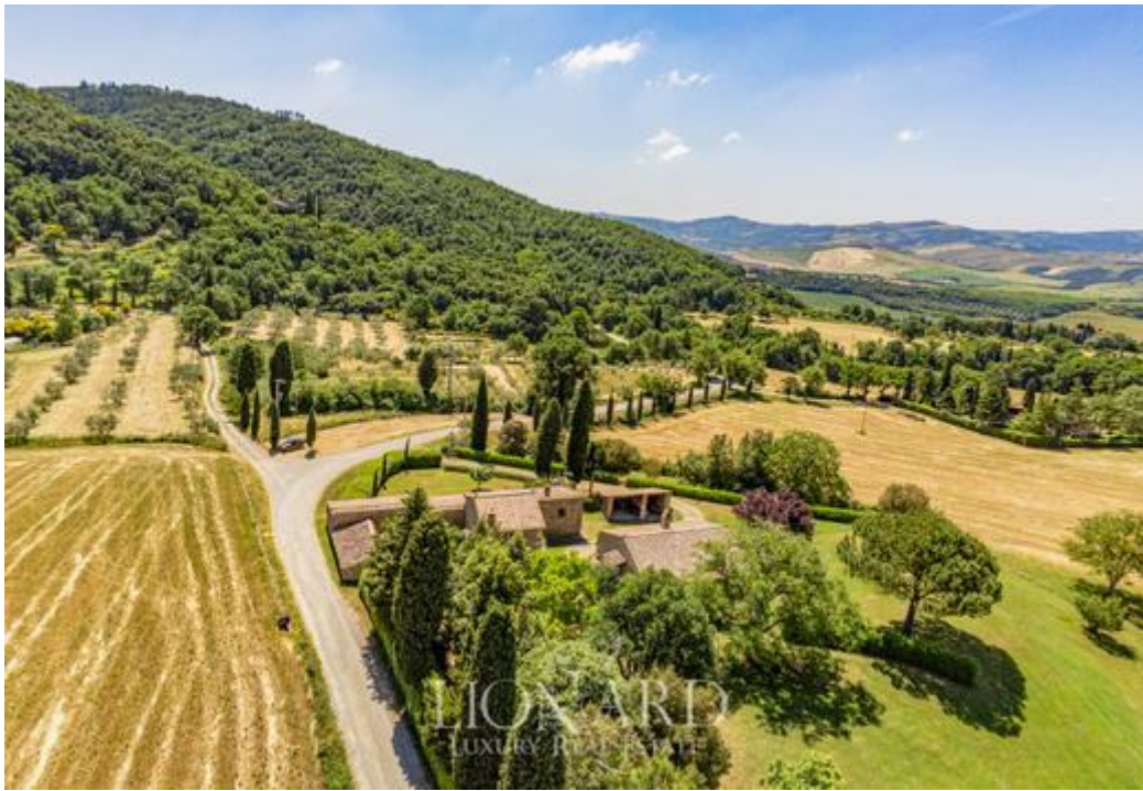
Рис. 2.1. Вигляд садиби у Валь д'Орчіа [40]

Із цього чудового села, розташованого на височині, відкривається унікальний панорамний краєвид на Валь д'Орча в провінції Сієна, відомій своїми милими пагорбами, засадженими оливковими галями і виноградниками.