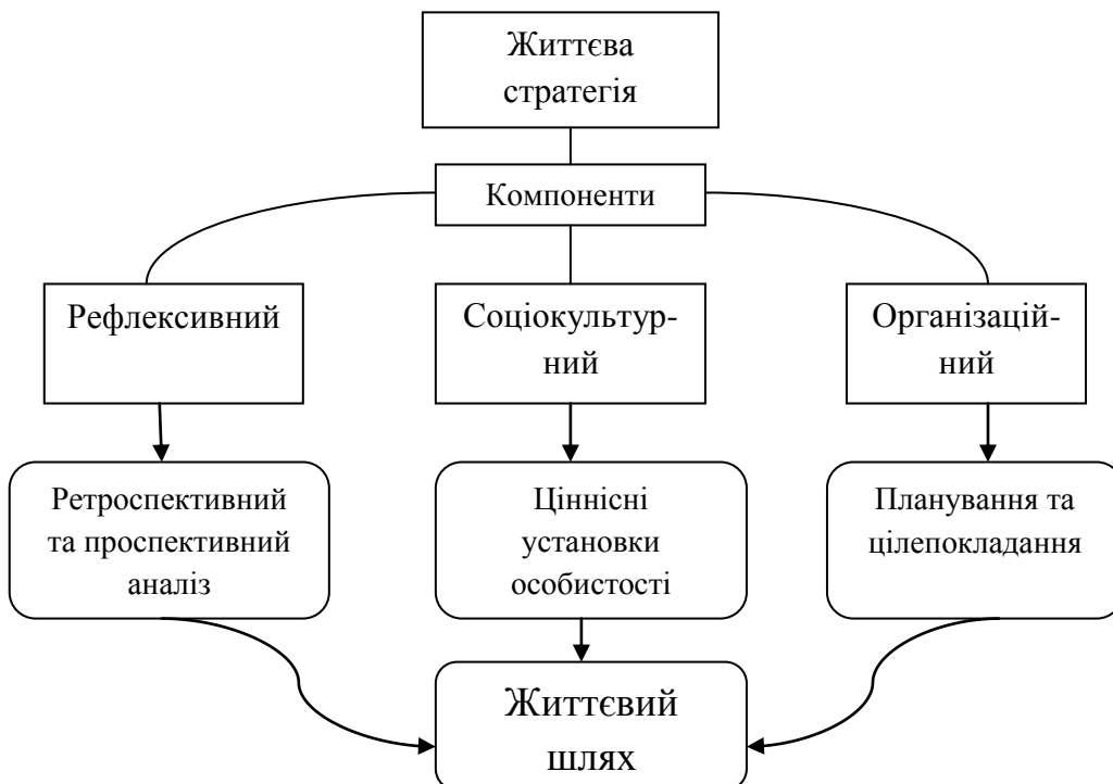
Рис. 2. «Модель формування життєвої стратегії»

Спираючись на дослідження вчених та власне ми можемо запропонувати наступну модель формування життєвої стратегії особистості, що включає в себе декілька етапів (рис. 2.):