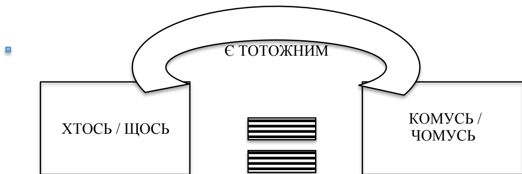
Рис. 3 Когнітивна модель концептуальної морфози

За допомогою концептуальної морфози когнруентності ЛЮДИНА ТОТОЖНА ПРИРОДІ, А ПРИРОДА ТОТОЖНА ЛЮДИНІ та лінгвокогнітивної процедури рефлексивності концептуальна царина, що позначає світ природи збагачується за рахунок концептуальної царини на позначення світу людей властивостями людей – умінням розмовляти. Тобто, субстантивований вигук "quack" є мовою качки. У данному випадку проявляється синкретизм природнього та людського, немає розщеплення цих світів та чітке усвідомлення різних функцій кожного. Когнітивною моделлю концептуальної морфози слугує така схема (рис. 3):