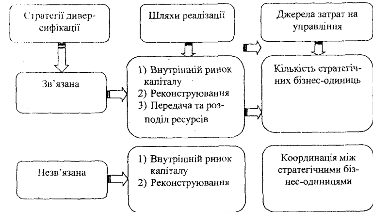
Рис. 1 Порівняння зв'язаної і незв'язаної диверсифікації підприємств

додання нових видів діяльності не можна вирішити всі виникаючі проблеми.