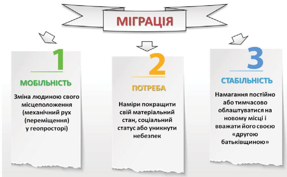
Рис. 2. Аспекти, які знаходяться в основі міграції як суспільно-географічного явища

Наприклад, поширені у всіх країнах маятникові переміщення населення, пов'язані із щоденними поїздками на роботу і додому з одного населеного пункту в інший, також відносяться до міграцій. Вони носять локальний характер і не впливають на географічний рисунок розселення, водночас здійснюють суттєвий вплив на формування «соціальної та економічної географії» регіонів, ядром яких є великі міста. Навколо останніх утворюються агломерації, які об'єднують приміські поселення різного рангу навколо центру, виконуючого роль економічної бази для все зростаючого вишир агломераційного утворення. Зростаюча мобільність ресурсів, якісні зміни в інформаційних і транспортних зв'язках забезпечують істотні трансформації міст і околиць. Це впливає не тільки на масштаби будівництва і вартість житла, але загалом – на соціокультурну природу величезної території, значно фрагментує середовище агломераційних зон, де центр контрастує з околицями і поступово «відрива-