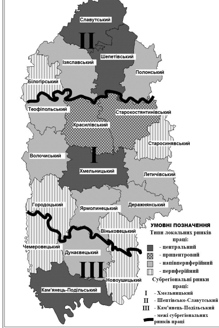
Рис. 3. Територіальна структура Хмельницького регіонального ринку праці (побудовано автором)

З табл. 1 видно співвідношення основних показників, що характеризують рівні працевзабезпеченості, напруженості, ціни та ефективності використання робочої сили, в розрізі субрегіональних ринків праці Хмельницької області.