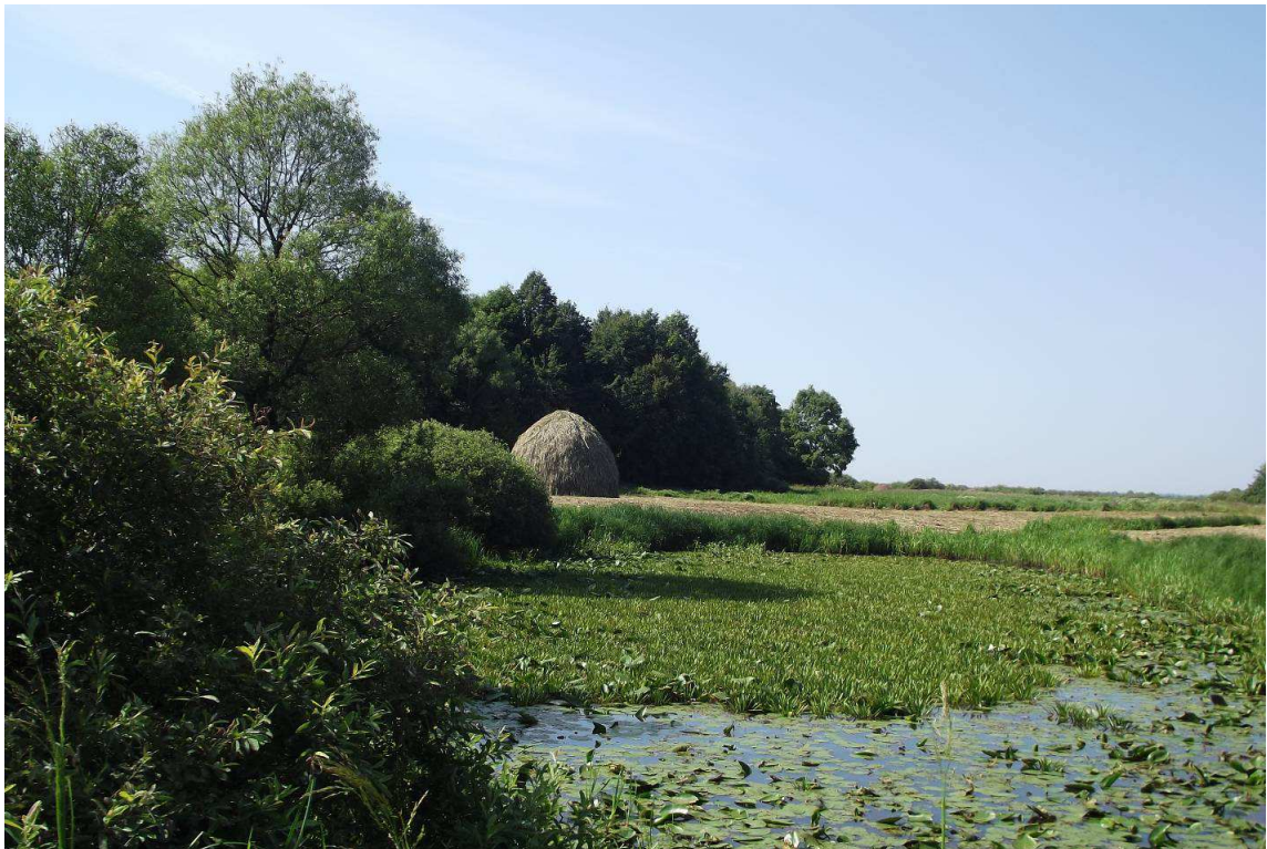
Рис. 2. Біотопи Придеснянської ділянки Національного природного парку «Деснянсько-Старогутський» (урочище Уборок).