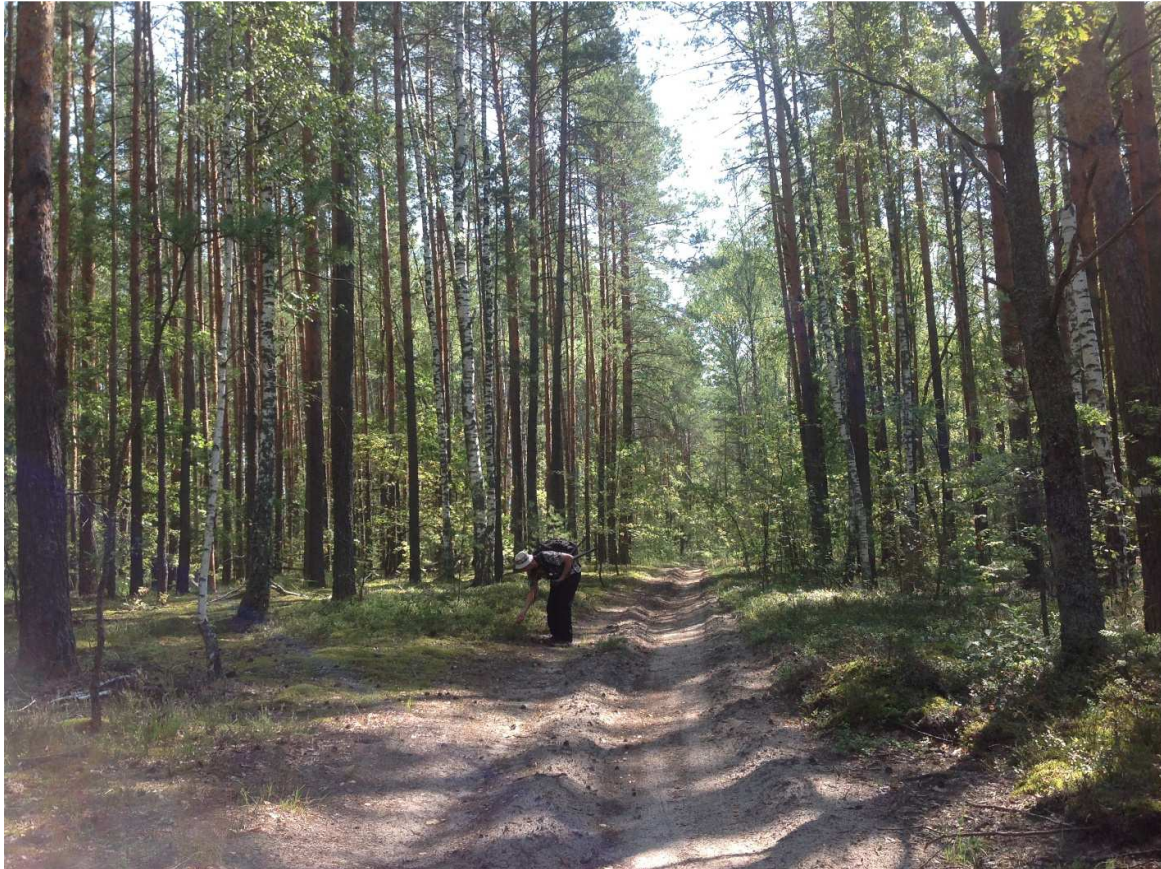
Рис. 3. Біотопи Старогутської ділянки Національного природного парку «Деснянсько-Старогутський».