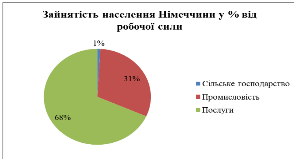
Рис. 2 Зайнятість населення Німеччини у % від робочої сили (за 2014 рік) (укладено за даними [ 6])

населення (75%) (Рис.2) [7].Однією з основних причин такого значного показника зайнятості населення України у сфері послуг є падіння промислового виробництва та закриття промислових підприємств, що відобразилось на частці зайнятих у сільському господарстві та сфері послуг відповідно (Рис.3).