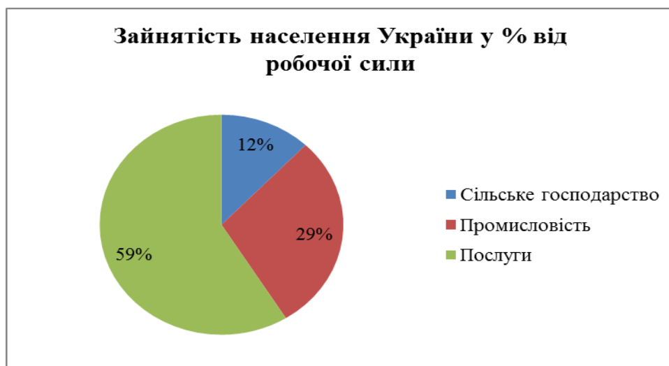
Рис. 3 Зайнятість населення України у % від робочої сили (за 2014 рік) (укладено за даними [ 6])

Висновки. Отже, еволюція людської цивілізації переконливо свідчить про велику роль, яку відіграють міські поселення у піднесенні держав, незалежно від часу їх історичного розвитку або географічного розташування: вони були й дотепер залишаються економічними, політичними та культурними