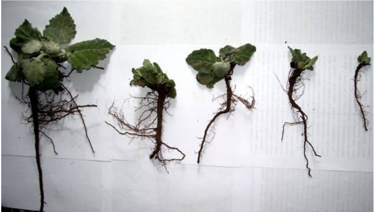
Рис. 3. Особини Salvia aethiopsis на різних стадіях розвитку (перша декада квітня 2006 р.).