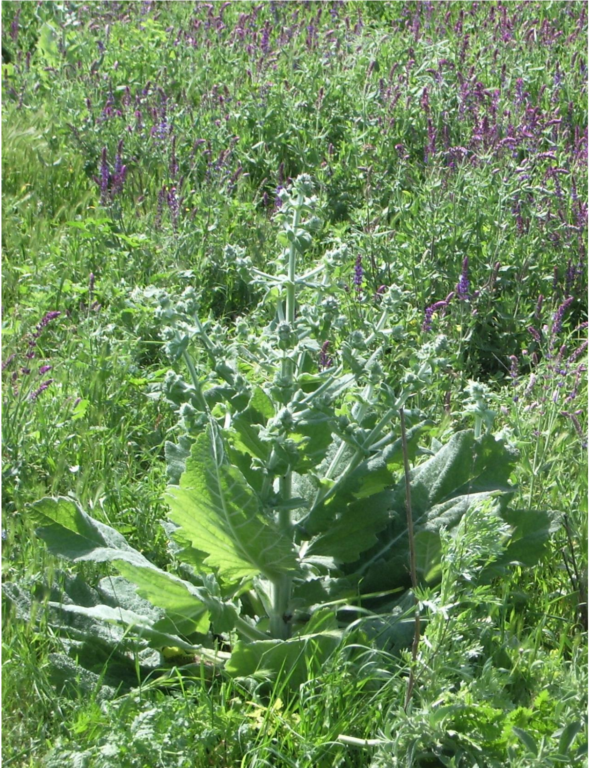
Рис. 1. Salvia aethiopsis в степовому різнотрав'ї степових схилів Північного Причорномор'я (третя декада травня 2006 р.).