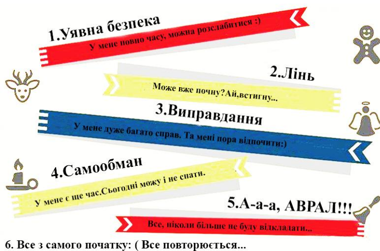
Рис. 1. Шість ознак прокрастинації

Провівши теоретичне аналізування доробок вчених з означеної проблематики пропонуємо наочно розглянути ознаки прокрастинації, що представлені на рисунку 1.