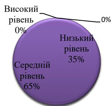
Рис. 2. Розподіл досліджуваних студентів за рівнем прокрастинації

Результати первинного статистичного аналізу рівня схильності до прокрастинації студентів наведено на рис. 2.