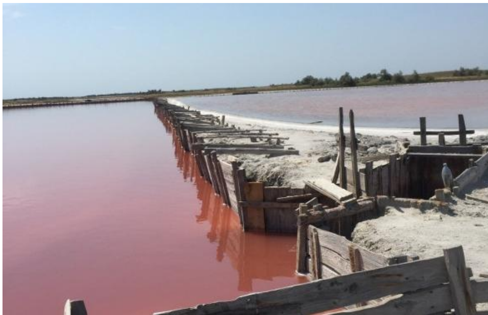
Рис. 2. Солоні озера села Геройське [3]

Також, враховуючи те, що історія села Геройське тісно пов'язана із Запорізькою Січчю, адже запорізькі козаки приходили добувати сіль та рибалити на цій території (рис. 2), у таборі заплановано проведення різнопланових пізнавально-виховних та розважальних заходів.