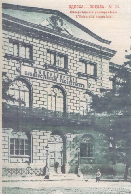
ОДЕССА.—ODESSA. № 111. Императорскій университетъ. L'Universite imperiale.