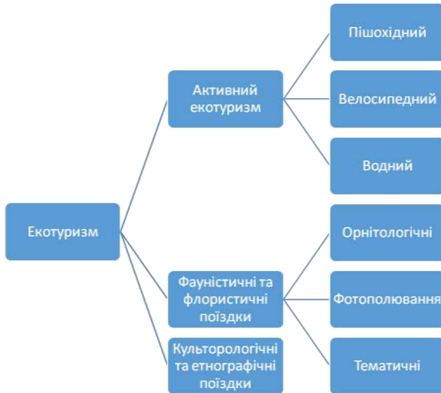
Рис. 1.2. Форми екотуризму

Екоагротуризм бере за основу розміщення туристів у гостьових будинках, які зазвичай розташовані на території біосферних заповідників та національних парків.