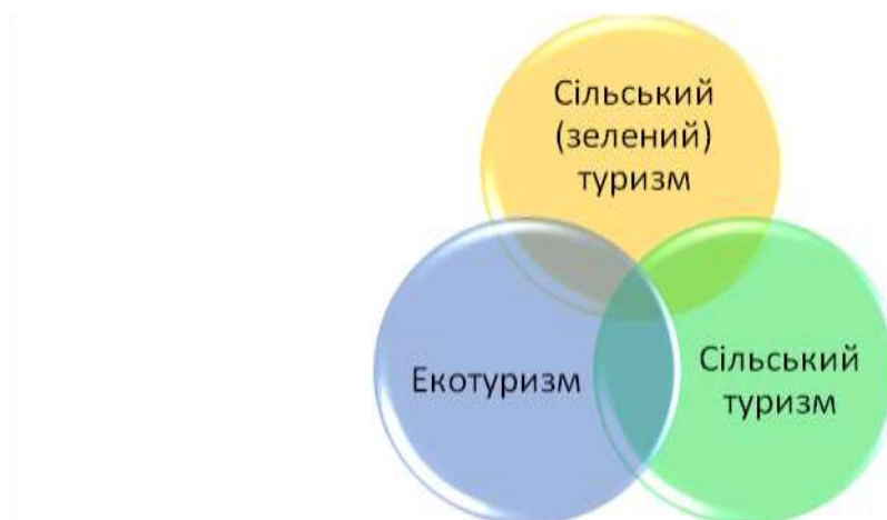
Рис. 1.1. Співвідношення видів туризму

Екологічний туризм (екотуризм) – це пізнавальний і відпочинковий вид туризму, зосереджений на природних (малозмінених людиною) територіях, який передбачає різні форми активної рекреації в природних ландшафтах без заподіяння шкоди навколишньому середовищу. Синонімом поняття «екотуризм» є зелений туризм, природничий туризм [9].