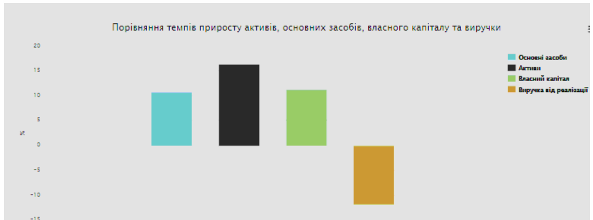
Рис. 2.1. Порівняння темпів приросту основних показників ПАТ «Придніпровське»

становить -24.2%, що є негативним фактором для досліджуваного підприємства. Динаміка показника фондівдачі наведена на рис. 2.4.