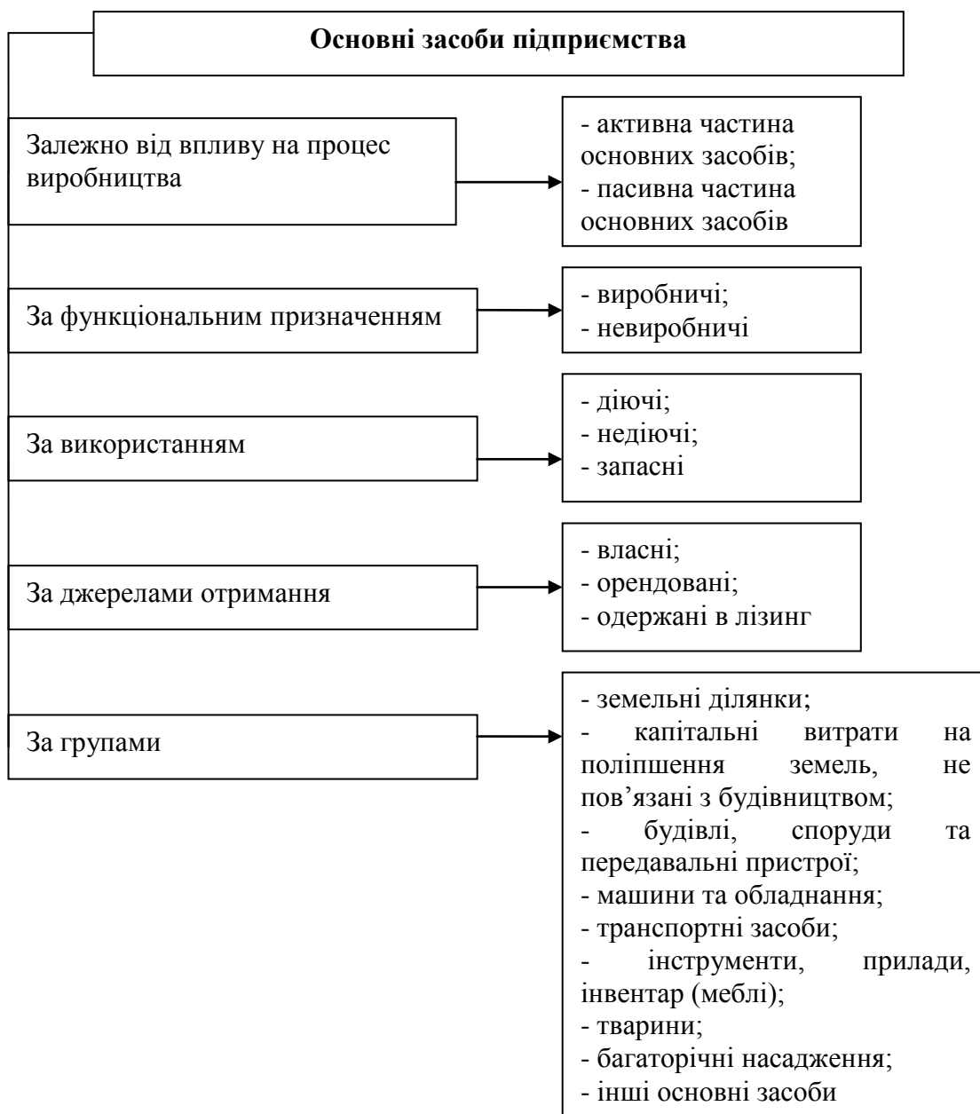
Рис.1.1. Класифікація основних засобів

виробничому процесі, як використовуються у виробництві їх поділяють на певні групи.