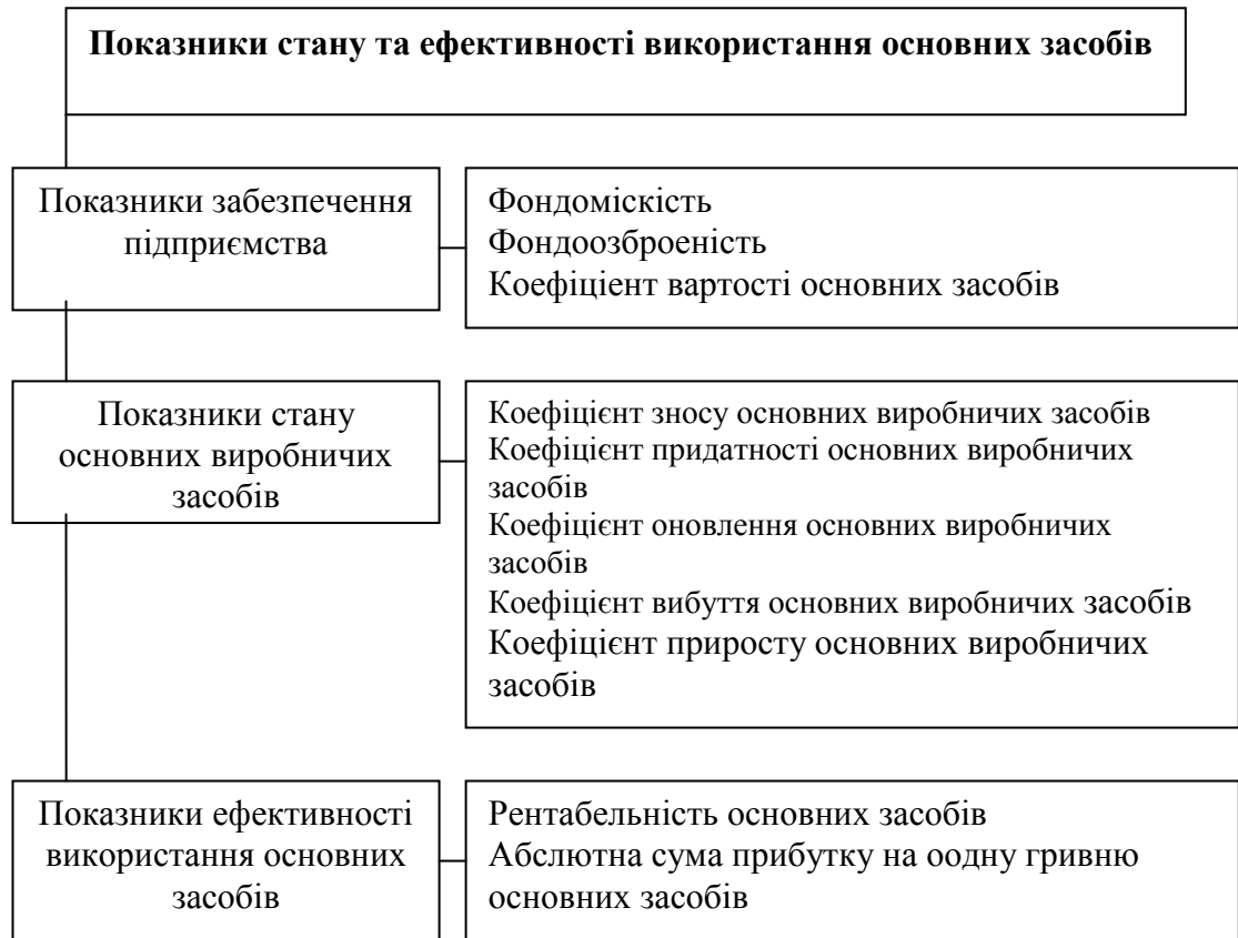
Рис. 1.2. Показники стану та ефективності використання основних засобів

Юрчишена Л. В своїх роботах наголшує, що «Фондоміскість є величиною зворотною до фондovіддачі. Цей показник дає можливість визначити вартість основних засобів на одну гривню виробленої продукції і характеризує забезпеченість підприємства основними засобами. За нормальних умов фондovіддача повинна мати тенденцію до збільшення, а фондоміскість – до зменшення»[32, с. 65]