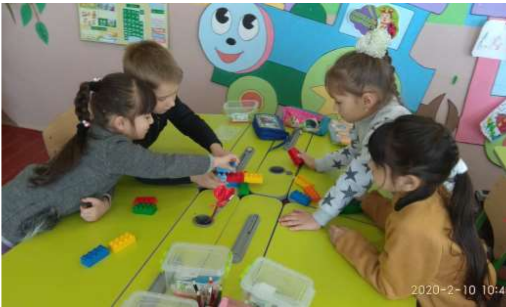
Рис. 2.8 Фотозвіт з прикладами застосування різноманітних технологій Нової української школи

Діти на уроці «Я досліджую світ» із задоволенням подорожували до Древнього Києва; на уроці математики допомагали казковим героям розв'язувати вирази, і тим самим яскраво прикрасили Новорічну ялинку. Також у парі зі своїм товаришем, розв'язуючи вирази, знайшли потрібну зубну щітку для «Бобра Суперзуба»; на уроці читання, вивчаючи літеру «К», за допомогою гри «Танграм», складали тваринку, у назві якої є ця літера. У навчальну діяльність також уводився елемент змагання у групах, що переводив дидактичне завдання в ігрове.