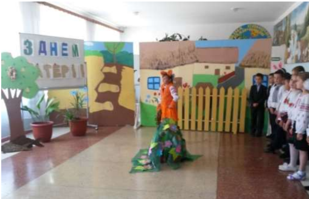
Рис. А.1 Фотозвіт до свята «Подарунок мамі»