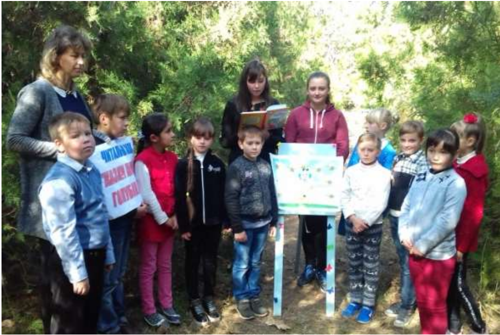
Рис 2.4 Фотозвіт з вивчення казок В.Сухомлинського «Школа під голубим небом»

В експериментальному класі, готуючись до театральної вистави, заздалегідь розроблявся композиційний план, а саме: хід гри, коло музичних тем, образів, не порушуючи при цьому логіки розгортання подій у творі. Наприклад, під час підготовки до вистави «Коза-дереза» ми діяли за наступним планом: