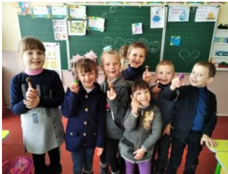
Рис. 2.3 Приклад використання елементів пальчикового театру

У позакласній роботі діти були ознайомлені з такими видами театрів: театр іграшок, настільний театр, театр рукавичок, ляльковий театр, тіньовий театр, театр ложок, пальчиковий театр (рис. 2.3).