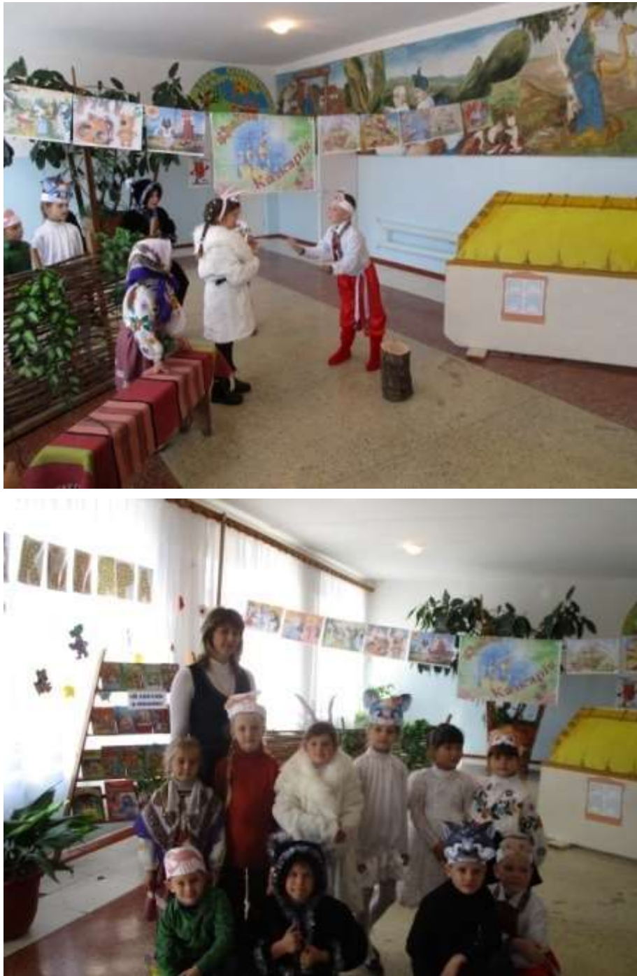
Рис. 2.5 Фотозвіт до театральної вистави «Коза-дереза»

свідчить фотозвіт, зображений на рис. 2.5.