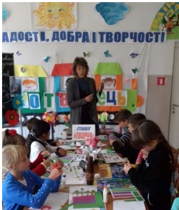
Рис.2.7 Приклад творчого заняття в «Школі радості добра і творчості»

Рис. 2.6 Приклад екскурсії в природу з подальшим описом побаченого Великого значення мало також проведення занять з позакласного читання. Діти активно залучалися до роботи з дитячою періодикою: відгадували загадки, кросворди, обговорювали вірші і казки, авторами яких були діти 6 – 8 років, створювали вироби власними руками. Ця робота приносила дітям велике задоволення, а також розвивала креативне мислення та творчу фантазію, про що свідчить зображення на рис.2.7.