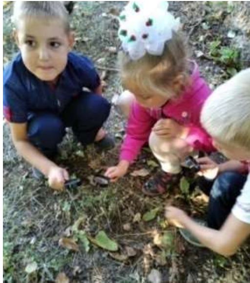
Рис. 2.6 Приклад екскурсії в природу з подальшим описом побаченого Великого значення мало також проведення занять з позакласного читання. Діти активно залучалися до роботи з дитячою періодикою: відгадували загадки, кросворди, обговорювали вірші і казки, авторами яких були діти 6 – 8 років, створювали вироби власними руками. Ця робота приносила дітям велике задоволення, а також розвивала креативне мислення та творчу фантазію, про що свідчить зображення на рис.2.7.

Розвитку уяви і фантазії сприяли екскурсії на природі та передача побаченого в описах, як зображено на рис.2.6.