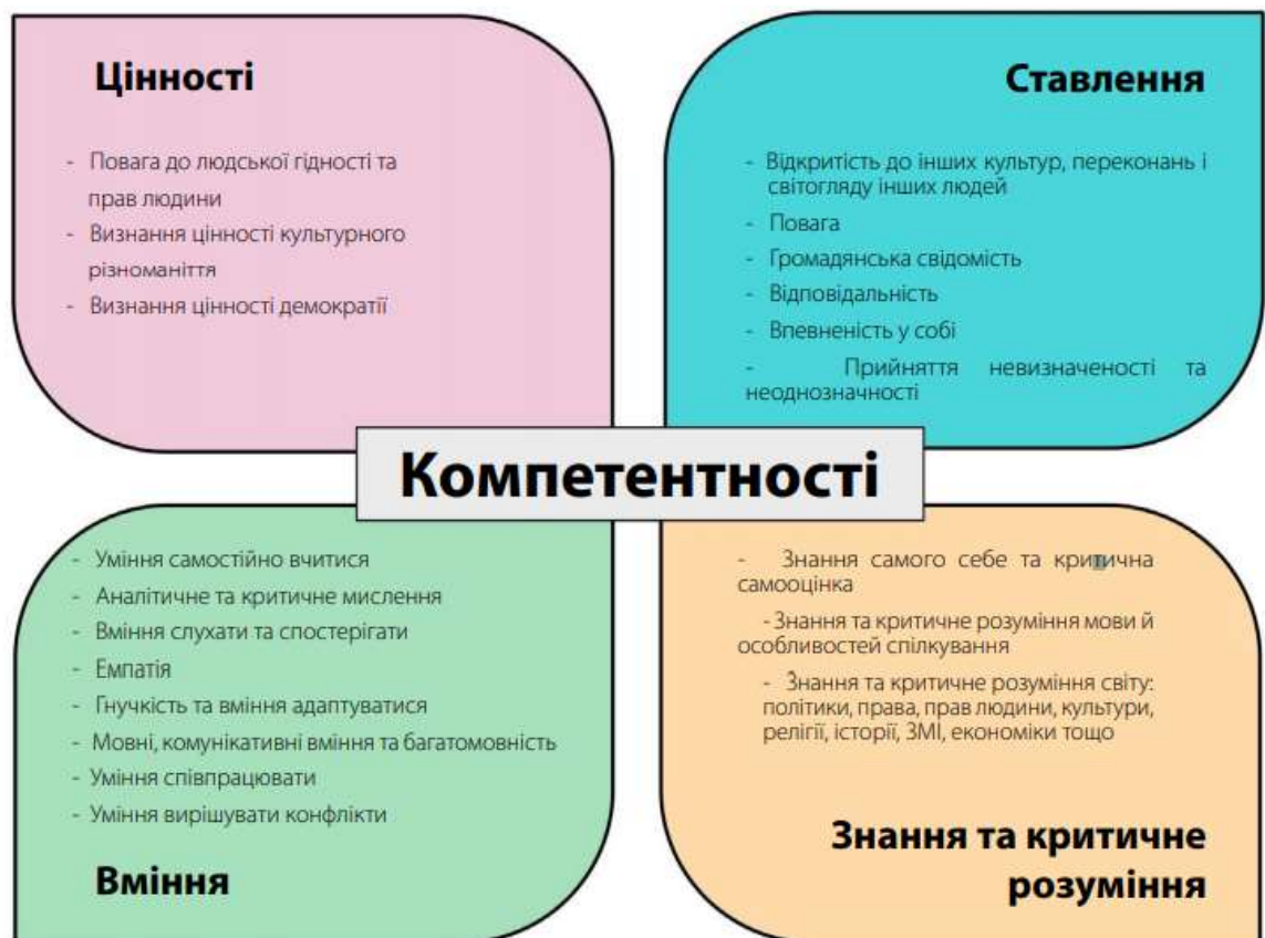
Рис.1.1.- РАМКА КОМПЕТЕНТНОСТЕЙ ДЛЯ КУЛЬТУРИ ДЕМОКРАТІЇ [10].

Компетенції Ради Європи щодо демократичної культури (CDC) висвітлюють спрощений огляд компетенцій громадян для того, щоб вони могли ефективно брати участь у культурі демократії. Ці компетентності не засвоюються автоматично, а натомість їх потрібно вивчити та практикувати. У цьому, роль освіти є ключовою. 20 компетенцій за демократичну культуру, часто іменованій CDC «метелик», охоплює чотири ключові області: цінності, ставлення, навички та знання та критичне розуміння(рис.1.1).