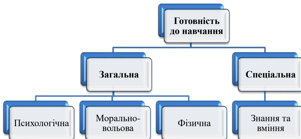
Рис. 1.1 Види готовності дошкільників до навчання в школі

Таким чином, дослідження психолого-педагогічної літератури дало змогу також з'ясувати, що видатні психологи та педагоги виділяють наступні види готовності дошкільників до навчання – загальна та спеціальна (Рис. 1.1.). Відповідно до цього в закладах дошкільної освіти повинна здійснюватися й відповідна підготовка загальна та спеціальна.